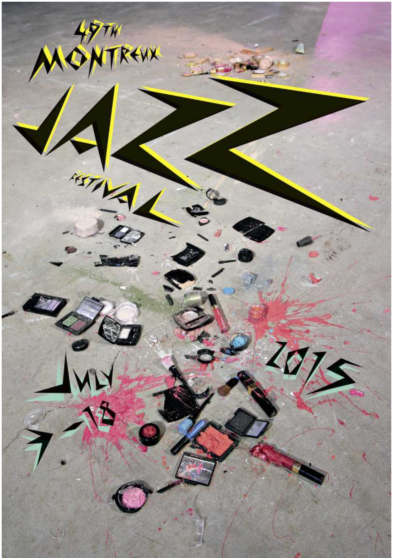
(© 2015 FFJM Sylvie Fleury)