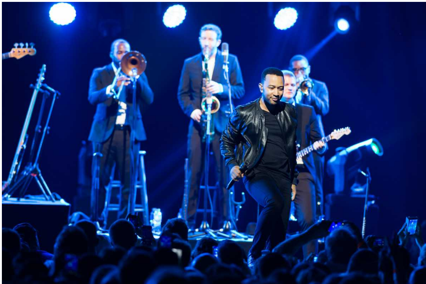
John Legend

Естественно, что ограниченное количество мест не может не сказываться на ценах. Организаторы прекрасно это понимают, потому предлагают меломанам самый широкий выбор бесплатных концертов. За две недели, что проходит фестиваль, за пределами основных залов под открытым небом проходят около полусотни бесплатных выступлений музыкантов со всего света.