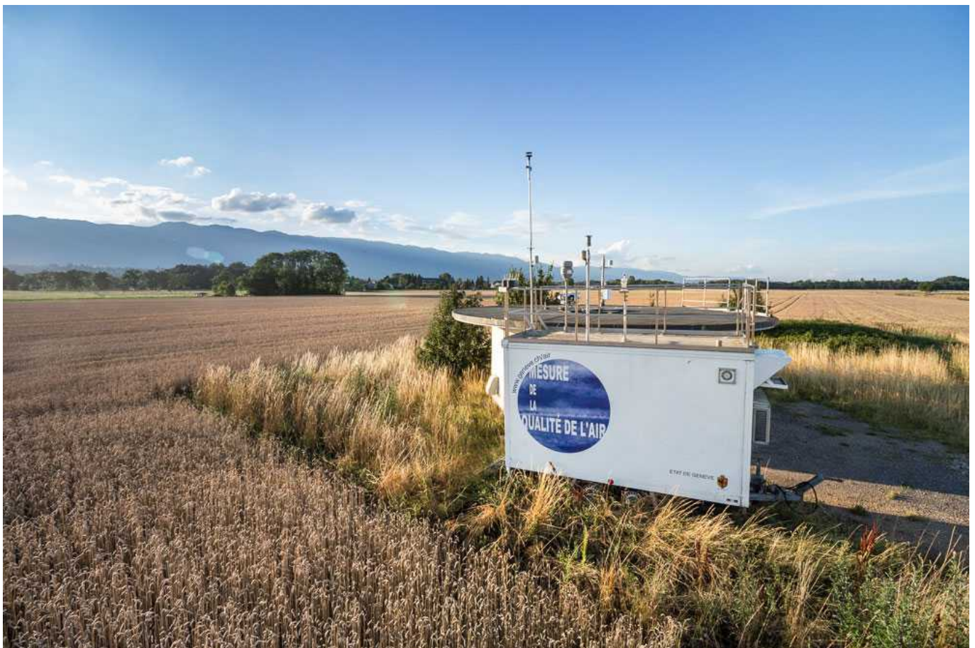
Станции измерения чистоты воздуха в кантоне (ge.ch)

По швейцарским нормам (и в соответствии с рекомендациями ВОЗ), за 12-месячный период уровень содержания озона не должен в среднем превышать 120 \mu\text{g}/\text{m}^3 в течение часа. В соответствии с планом DETA, если на двух контрольных станциях по измерению чистоты воздуха в кантоне будет зафиксирован рост концентрации озона свыше 180 \mu\text{g}/\text{m}^3 , то автомобилистам будет рекомендовано снизить скорость на автостраде до 80 км/ч. Если ситуация не улучшится в течение двух дней, ограничение скорости станет обязательным.