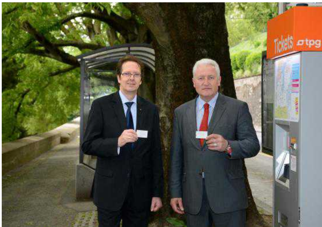
Представитель Unireso и глава DETA рекламируют новинку

предусмотрено», – говорится в разъяснениях DETA. Но даже несмотря на это ограничение, расходы кантона на возмещение разницы компаниям общественного транспорта могут достигать 33 тысяч франков в день.