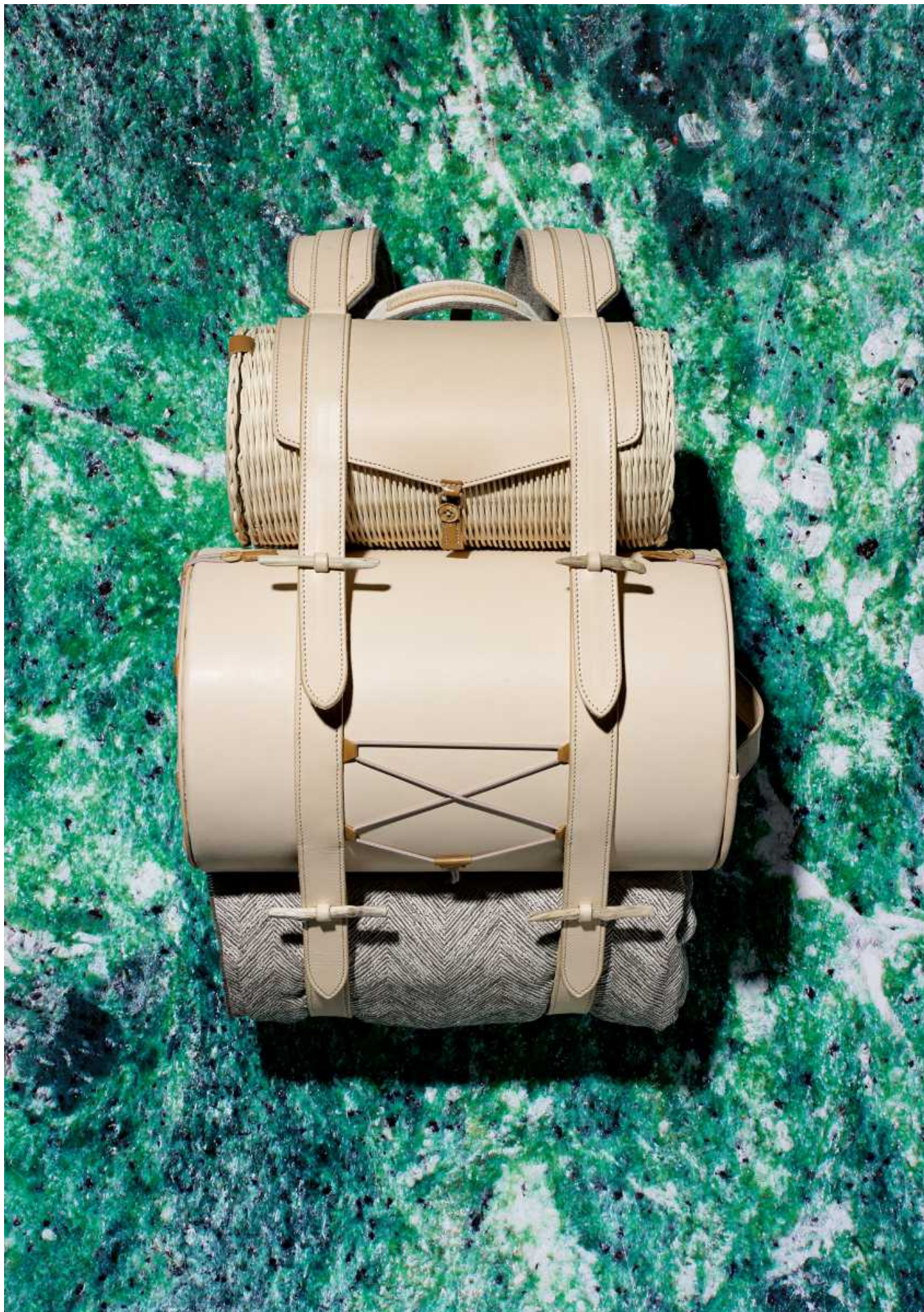
Рюкзак "Романтическое приключение". Идня Алексиса Туррона (ECAL), воплощение