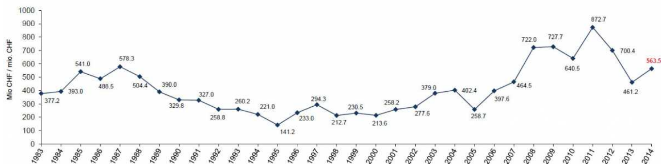
Entwicklung der Kriegsmaterialexporte Evolution des exportations de matériel de guerre 1983 - 2014

швейцарское оружие экспортеры оружия продажа вооружений швейцарией Швейцария