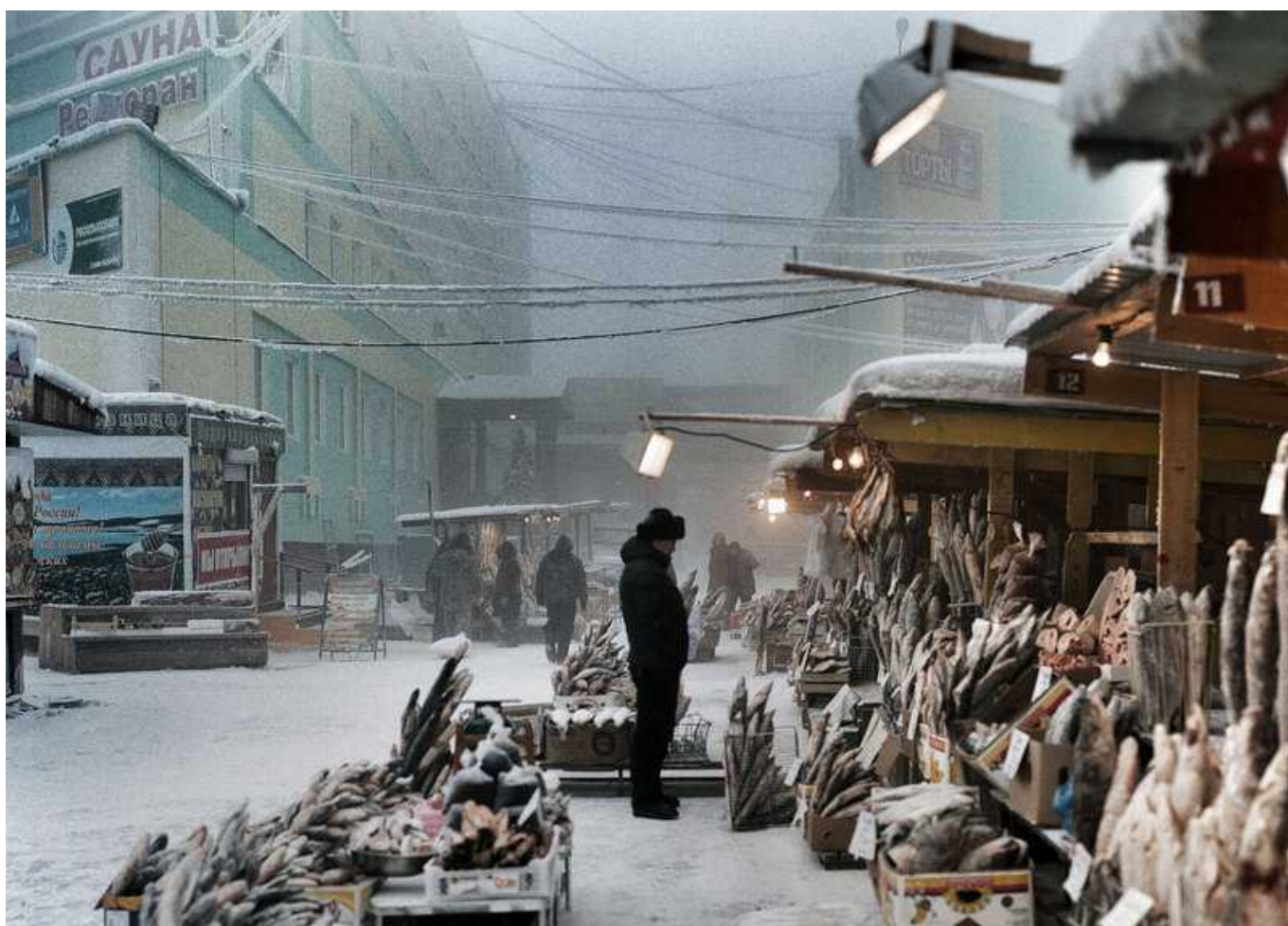
Якутск глазами фотографа Стива Юнкера

Автор: Надежда Сикорская, Женева-Париж , 29.10.2014.