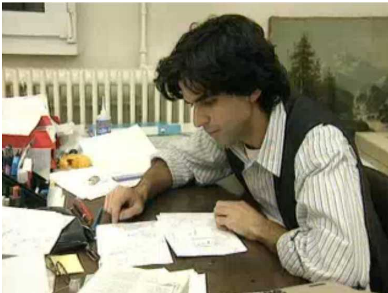
Патрик Шаппатт за работой

...В 1965 году, по поводу полувекового юбилея французской сатирической газеты «Le Canard enchaîné», журналисты RTS побеседовали с ее карикатуристами. Главное лицо программы – автор рисунков Ролан Муазан . Карикатуры Муазана на Шарля де Голля и его политические шаги выходили на страницах издания каждую неделю. На вопрос об этих рисунках автор ответил, что не считает себя бестактным по отношению к оригиналу, и добавил, что де Голль, который наверняка видит карикатуры в газете, вряд ли остается недоволен, «ведь я часто изображаю его королем».