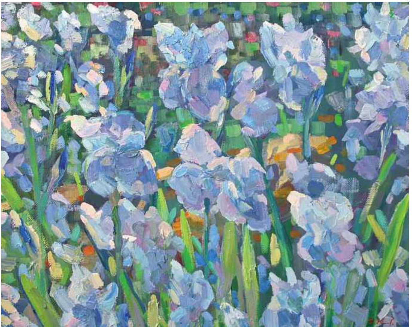
Ирина Ковалевская "Ветреные ирисы"

Автор: Дарья Симакова, Монтре , 04.07.2014.