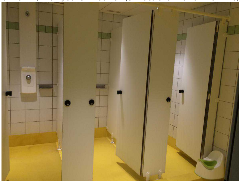
войной мест земного

Отметим, что проблемы беженцев касаются не только выходцев из охваченных