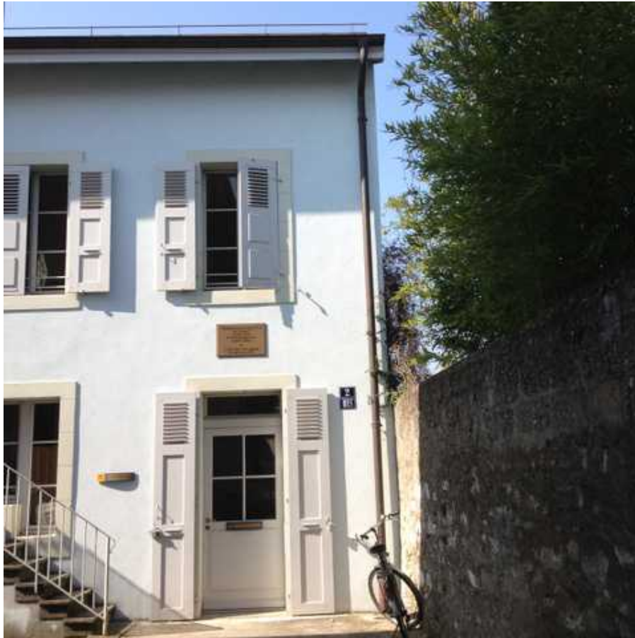
Еще одно ленинское место в Женеве