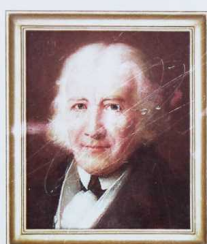
Frédéric - César de La Harpe

Лагарп – наставник из кантона Во и близкий друг царя.