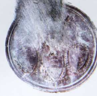
Médailles du sculpteur Pradier