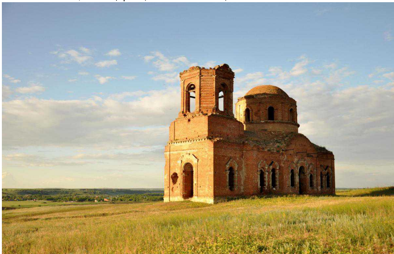
Церковь Сурб Карапет, Ростовская область, Россия