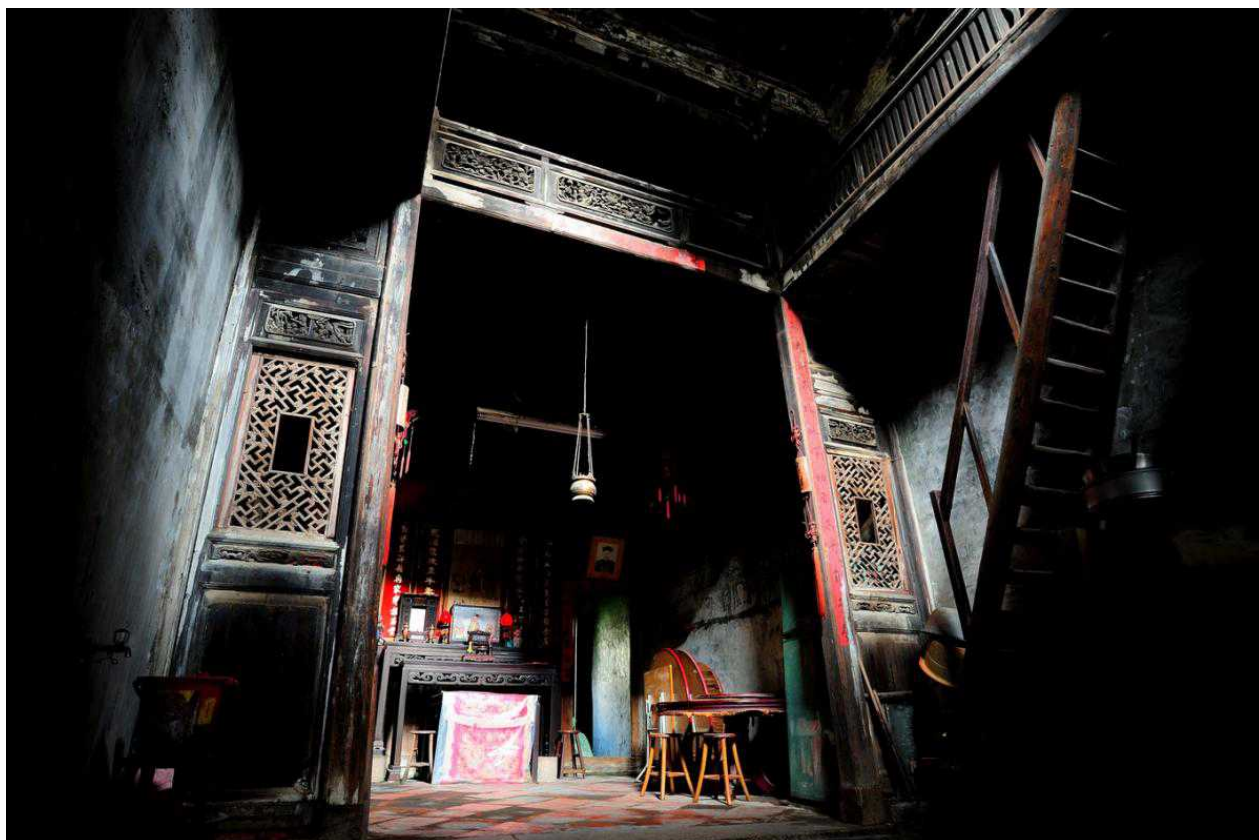
Дом семьи Ши, Тайвань