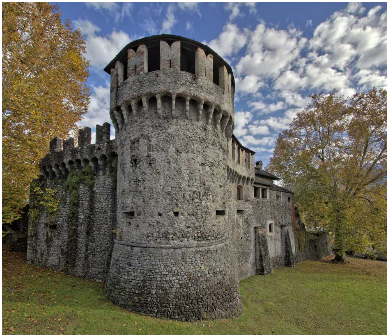
Locarno Castello, Швейцария