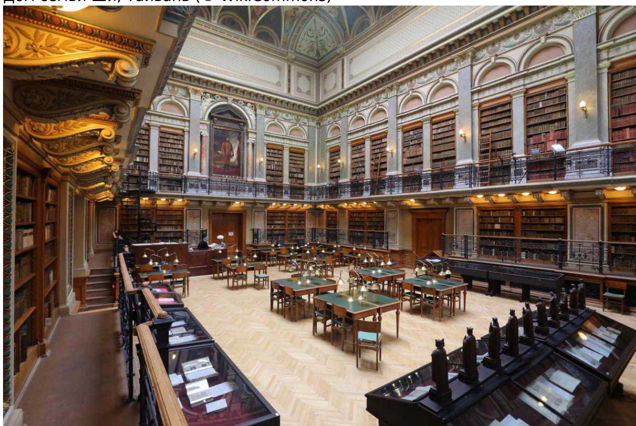
Библиотека Университета Будапешта, Венгрия