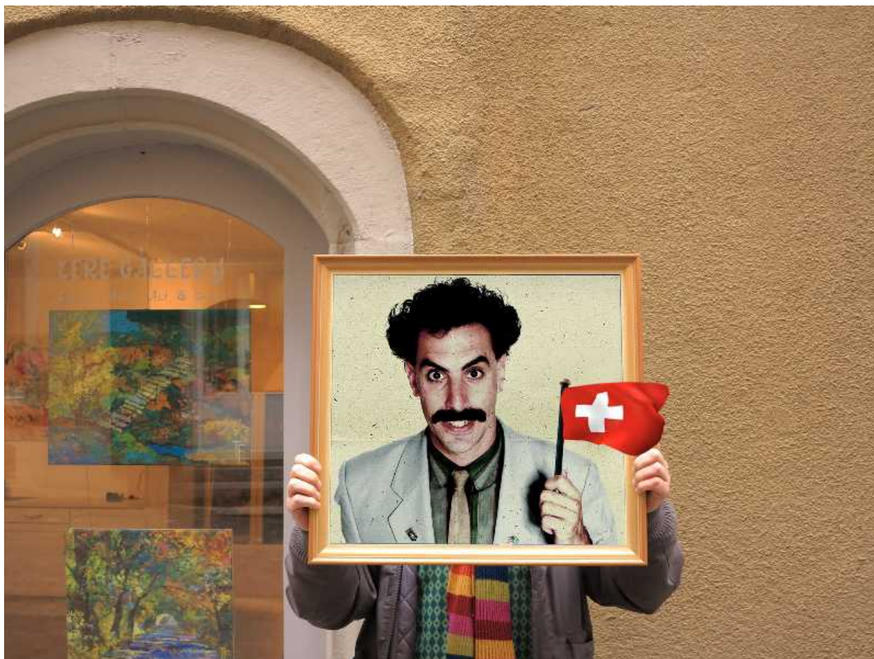
Убить Бората Сагдиева! искусство в Швейцарии

Source URL: https://nashgazeta.ch/news/cultura/16733