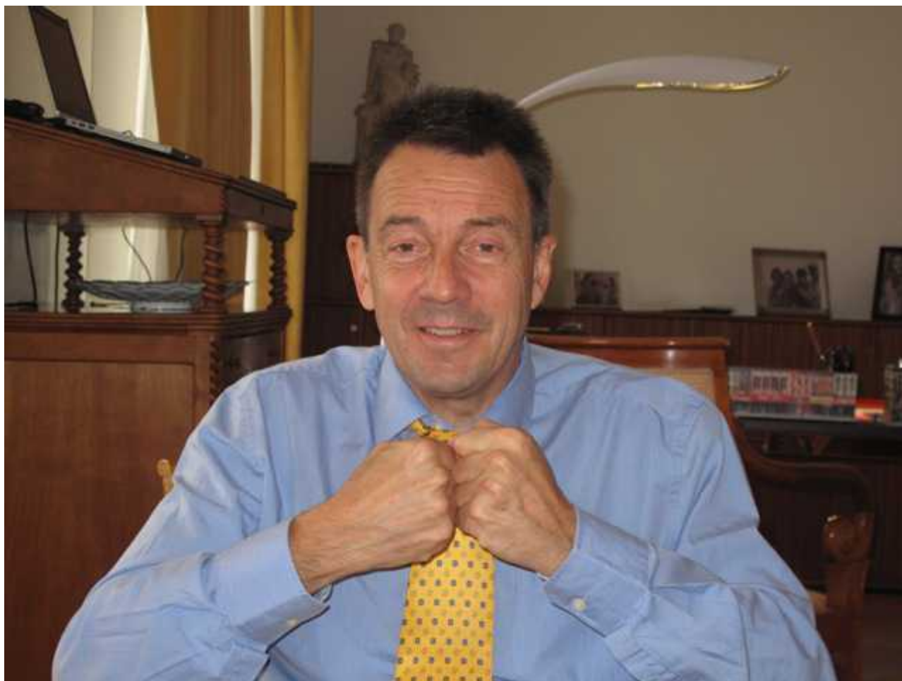
Президент Международного Красного Креста Петер Маурер

Автор: Надежда Сикорская, Женева , 23.10.2013.