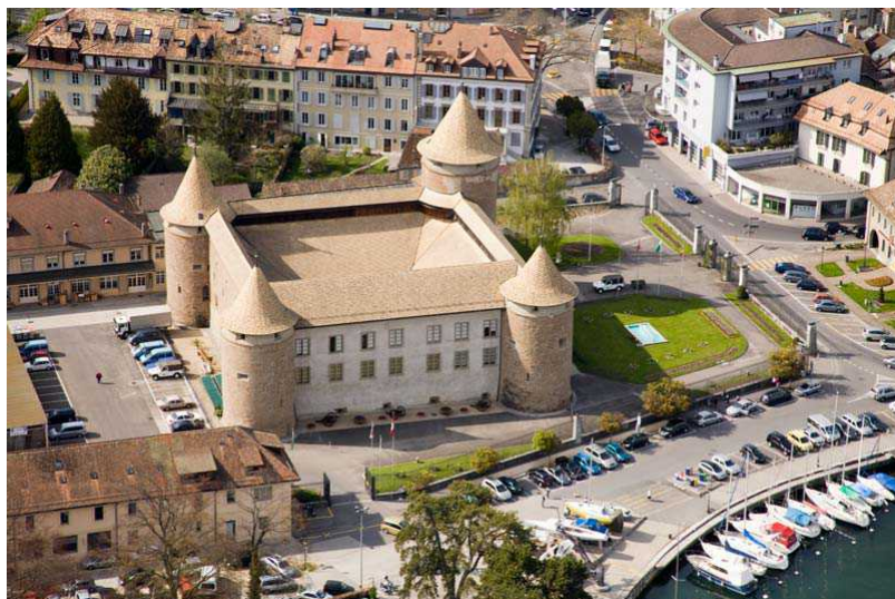
Шильонский замок – один из

После захвата региона Во Берном в 1536 году замок – построенный по типу римских военных лагерей – стал резиденцией бернских бальи (чиновников, выполнявших административные и судебные функции), однако на жителей это никак не отразилось. После Водуазской революции 1798 года замок перешел во владение новосозданной «Леманической Республики», чтобы в 1803-м превратиться в арсенал, а с 1925-го – в водуазский историко-военный музей.