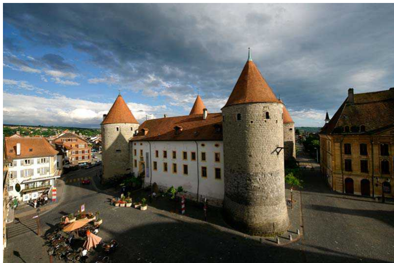
Леманом, замок Эгль издалека

весело помахивает флажками своих башен. Вокруг простираются пышные виноградники. Замок был построен здесь в XII веке. В конце августа 1475 года, во время Бургундских войн, твердыню захватили жители коммуны Занен, которые действовали в интересах Берна.