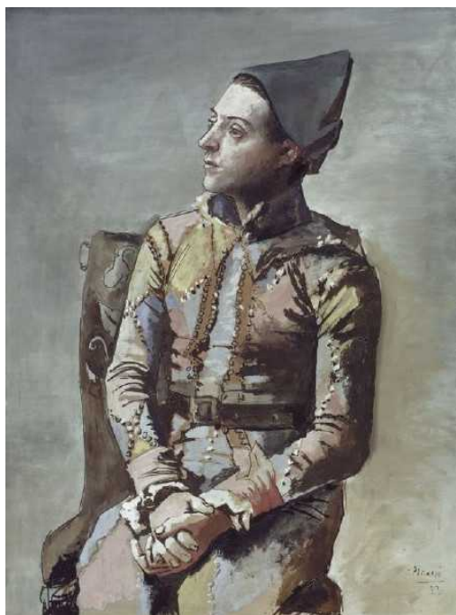
Сидящий Арлекин. Пабло Пикассо. 1923

Всего на выставке собрано около 60 картин, более сотни рисунков и набросков, созданных в разные периоды творчества. Это немыслимое богатство и великолепиие хранится в Базеле – в государственных музеях или в частных коллекциях. Как вышло, что Пикассо стал одним из самых популярных художников среди местных жителей?