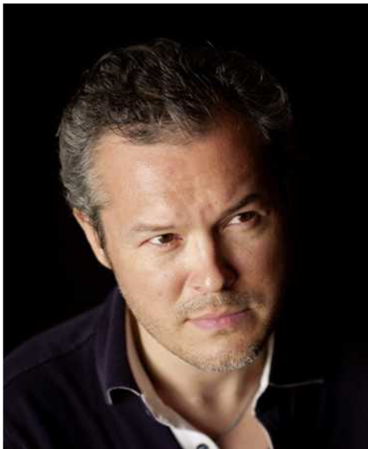
Казуки Ямада, Вадим Репин

28, 29 и 30 ноября выдающийся российский скрипач выступит в Женеве и Лозанне в сопровождении Оркестра Романдской Швейцарии под управлением японского дирижера Казуки Ямады.