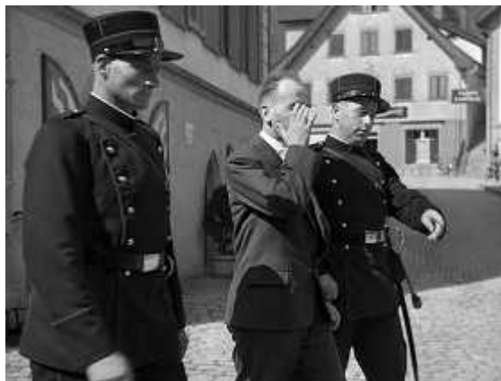
Последний казненный в Швейцарии