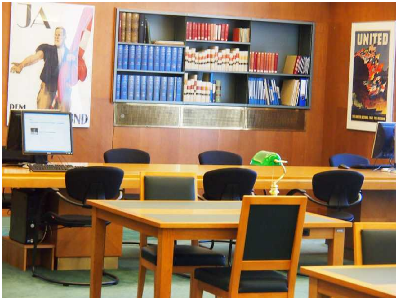
Обновленный читальный зал имени Рокфеллера