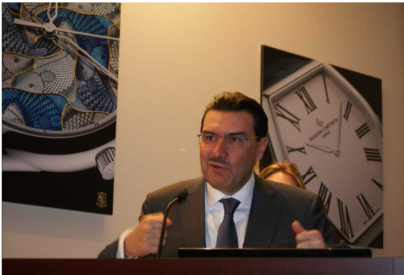
Хуан-Карлос Торрес, глава Vacheron Constantin (© NashaGazeta.ch)

Автор: Людмила Клот, Женева , 17.01.2012.