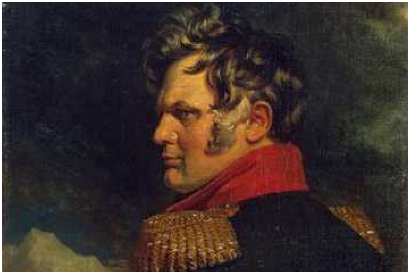
Портрет Алексея Петровича Ермолова работы Джорджа Доу