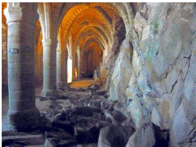
Тюремная галерея Шильонского замка