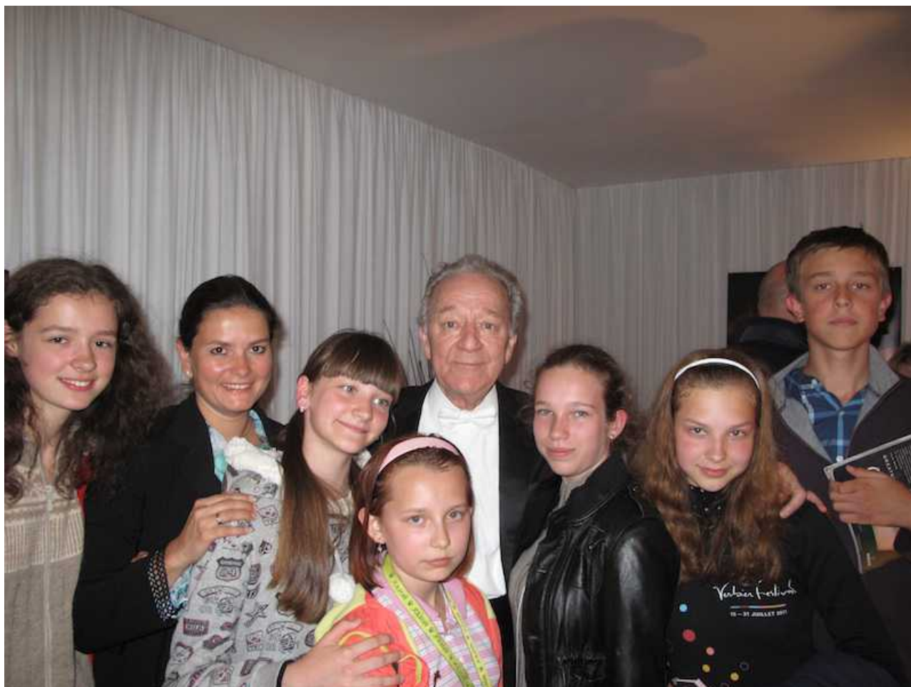
Юрий Темирканов и дети Фонд Нева фестиваль в Вербье

Source URL: https://nashagazeta.ch/news/12105