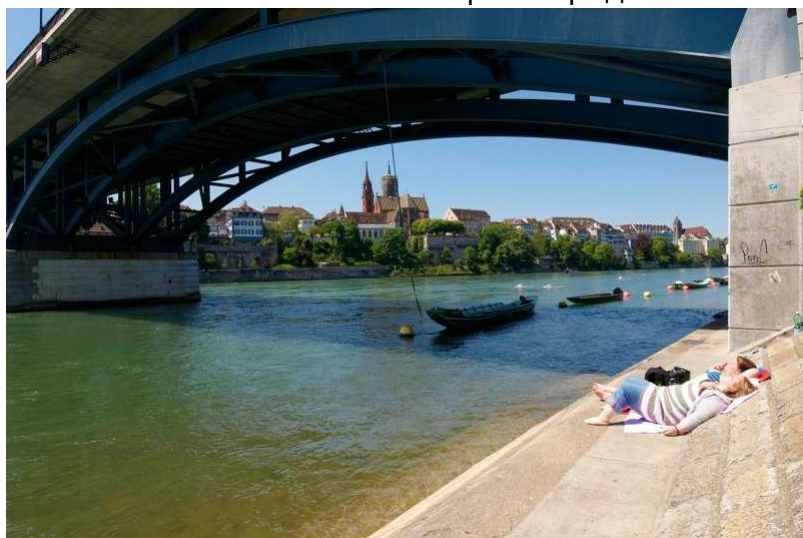
В городе на Рейне

Хвала и слава часовым мастерам города на Рейне!