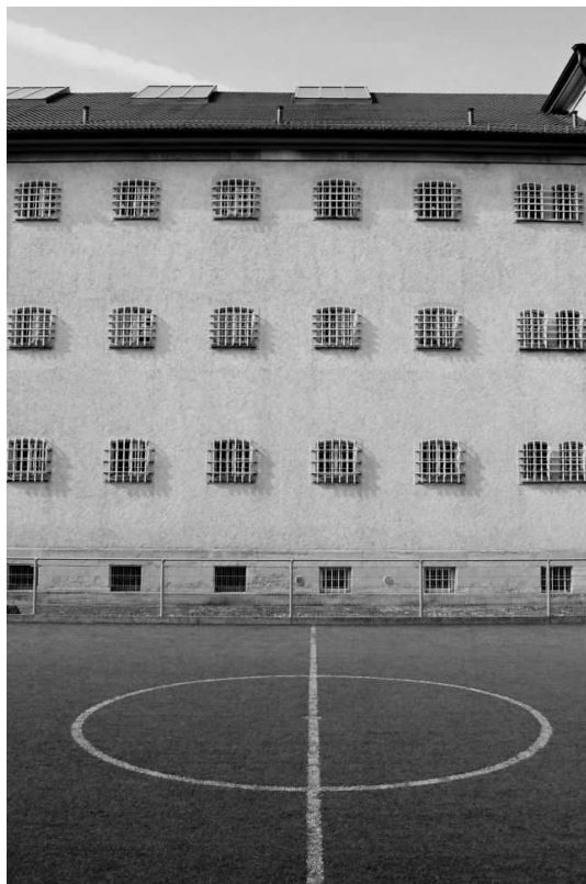
Официальное фото ленцбургской тюрьмы

Они и не играют. Они живут на сцене. В пьесе нет больших монологов и диалогов. Для моих актёров в данном случае театр – это и есть сама жизнь. И Годо для них – это свобода. Годо, как свобода, не приходит – ни в пьесе, ни в их жизни. Зрители, придя в тюрьму на спектакль, тоже на два часа теряют свободу, и становятся как бы соучастниками спектакля.