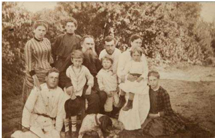
Л.Н. Толстой со своей семьей, в Ясной Поляне, в 1884 году

конечно, был необыкновенным человеком. Очень спортивным, у них в Ясной Поляне была площадка для игры в теннис, они плавали, катались на лошадях. Кстати, этим он часто удивлял своих гостей, которые представляли себе некоего древнего философа, умудренного годами, в общем, думающего человека... А он был физически крепким, здоровым, любил ходить пешком до Москвы из своего имения! Это занимало несколько дней, он ночевал у крестьян, но получал необыкновенное удовольствие от физической активности. И в школе, которую открыл для ребятишек, особое значение придавал спорту»... Одним словом, современный мыслитель и педагог!