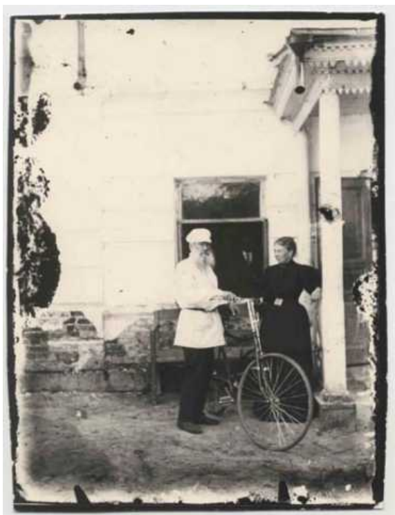
Лев Николаевич с Софьей Андреевной и тем самым велосипедом. Ясная Поляна, 1895г.