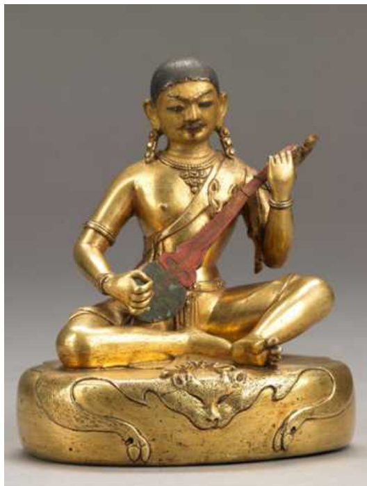
Друкпа Кунли (1455-1529), скульптура XVIII в.

форме передают основы их учений. Все изображения изобилуют живописными деталями, на некоторых одновременно изображено сразу несколько историй и событий. Стоит остановиться и всмотреться в одежды персонажей и черты окружающего их мира – горные пейзажи, цветы, силуэты рек и животных.