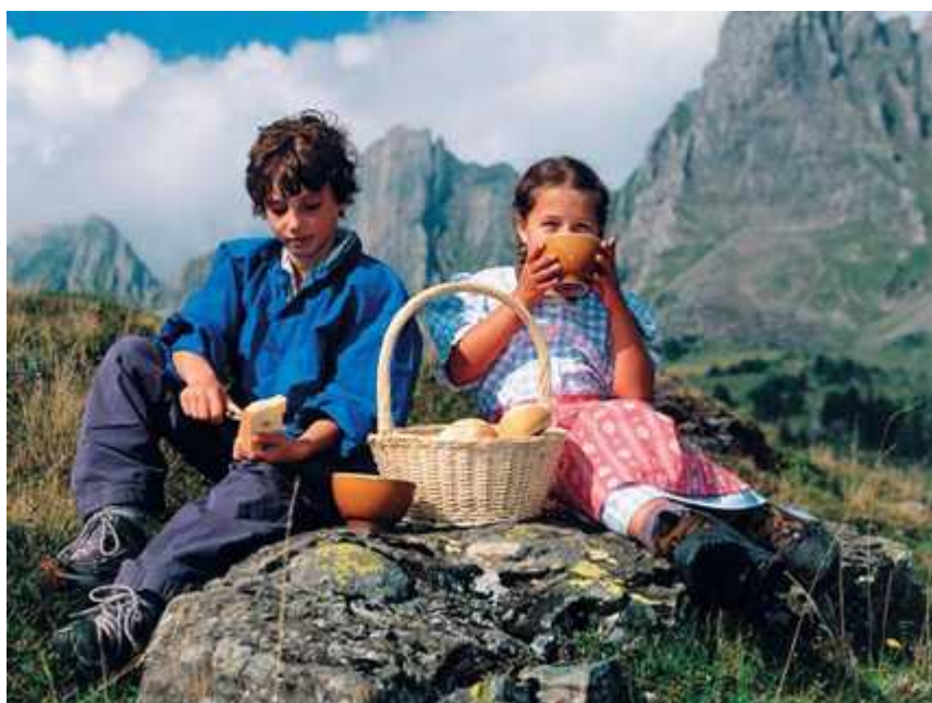
Хайди и Петер-козопас, кадры из фильма

Auteur: Людмила Клот, Хайдиланд , 11.06.2010.