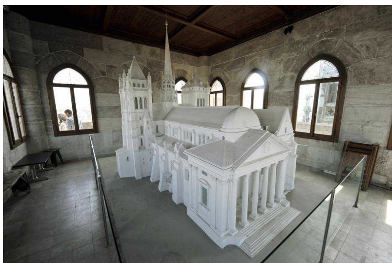
Макет собора в Северной башне (TDG)

Под сводами громадного собора холодно и одиноко. Голые серые стены были когда-то покрыты католическими фресками, храм украшали статуи святых. После 1536 г. Все это исчезло. Единственными украшениями сейчас служат витражи и резные спинки скамей. Под собором находится музей, где представлена история храма – от католических истоков до прихода реформации и вплоть до наших дней. Там, где когда-то проливалась кровь за единую букву церковного учения, теперь равнодушно бродят туристы, вяло фотографируя суровое убранство протестантского собора. В углу под кафедрой проповедника стоит деревянный стул, высокий и узкий. Он именуется «Стулом Кальвина».