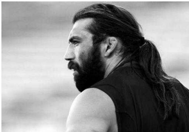
"Пещерный человек" Себастьян Шабаль