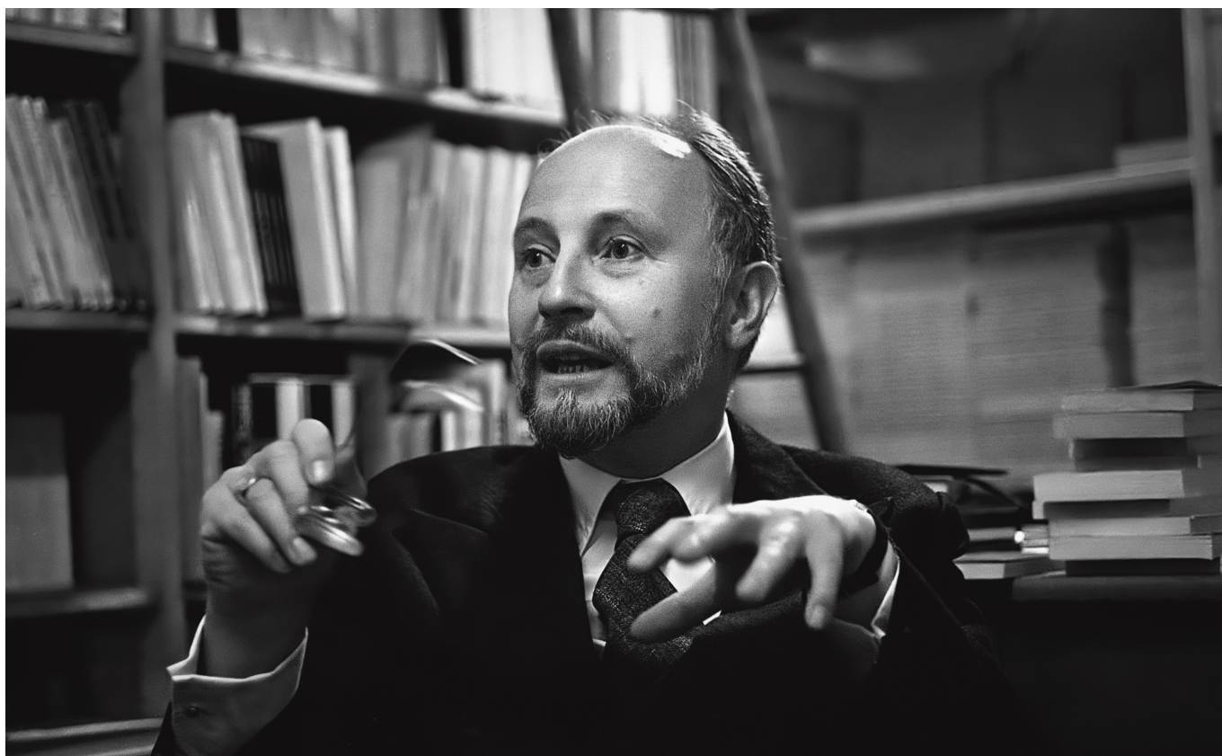
Vladimir Volkoff, 1979, Lausanne

Ainsi tient en un seul paragraphe une vie romanesque que se disputent Russes, Américains et Suisses. Sur les six photographies qui lui sont consacrées, il apparaît tantôt totalement absorbé par l'écriture (toujours debout !), tantôt souriant et détendu.