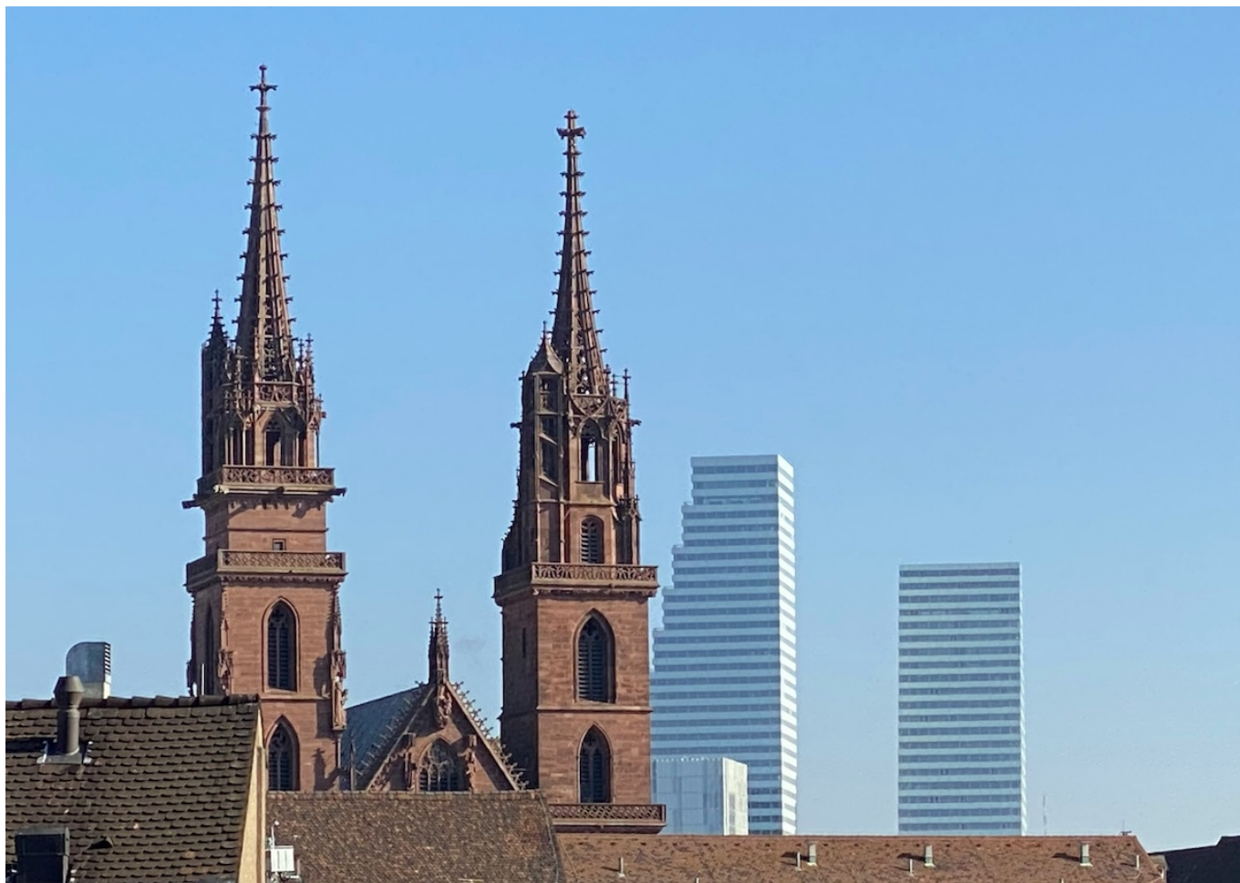
Башни Roche на фоне панорамы Базеля.

Auteur: Заррина Салимова, Базель , 05.12.2025.