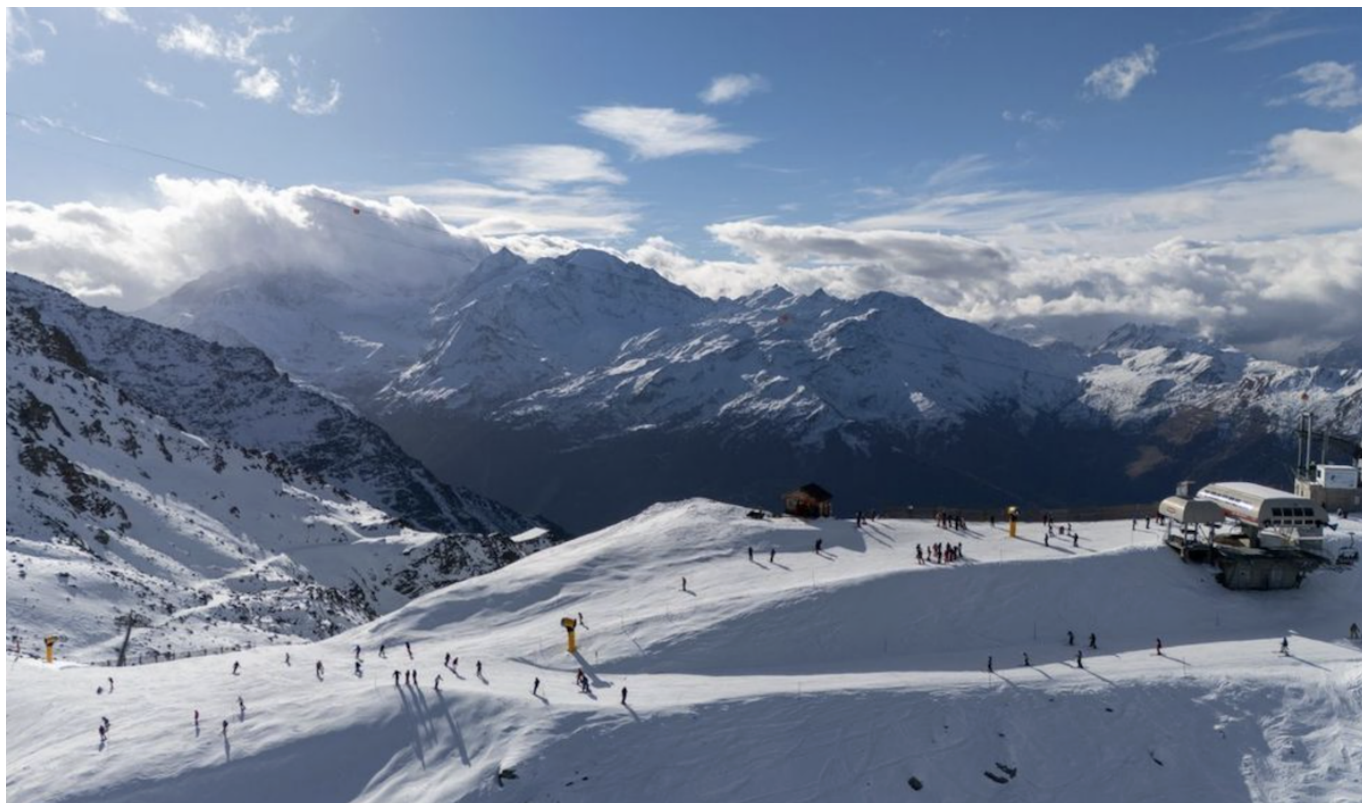
Зима в Вербье.

Auteur: Заррина Салимова, Берн , 21.11.2025.