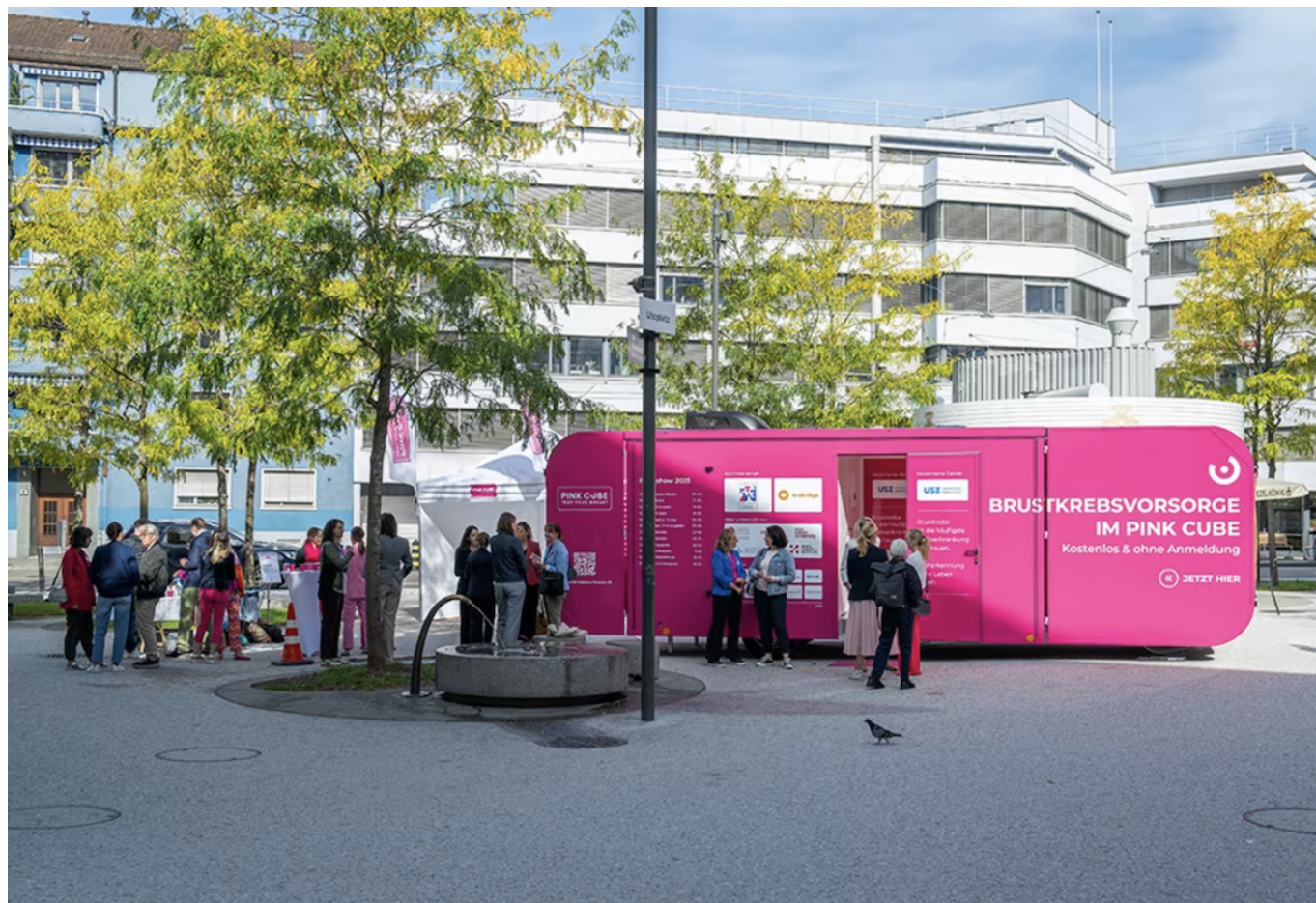
Открытие PINK CUBE Roadshow в Цюрихе 6 сентября 2025 года на Utoplatz/Sihlcity.

Решающим фактором остается раннее выявление заболевания, поэтому регулярные профилактические осмотры и самоосмотры играют ключевую роль. Обратив внимание на важность ранней диагностики рака груди призвана и акция Pink Cube, проводимая в октябре под эгидой Europa Donna Schweiz и Швейцарской лиги по борьбе с раком.