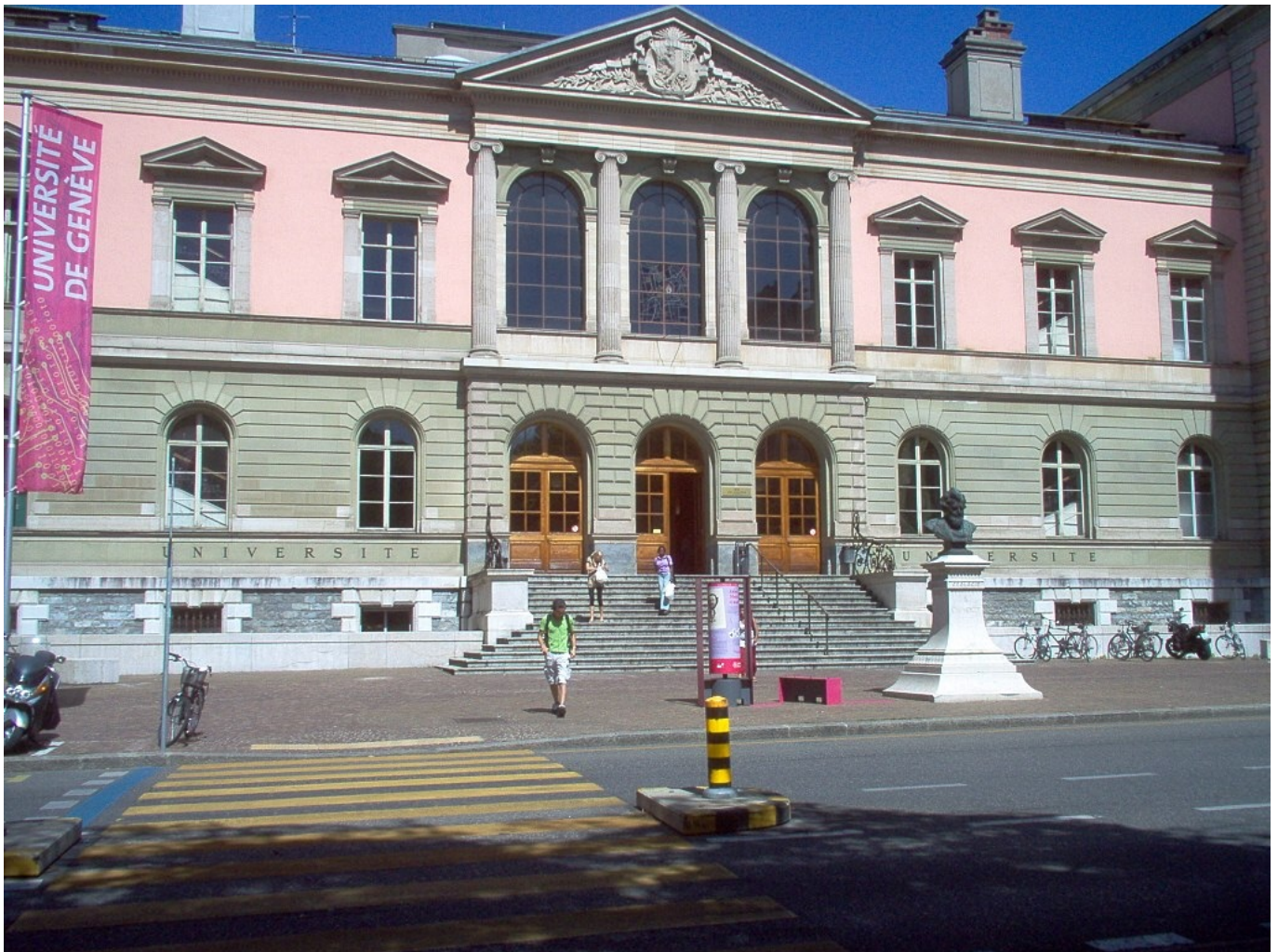
Женевский университет.