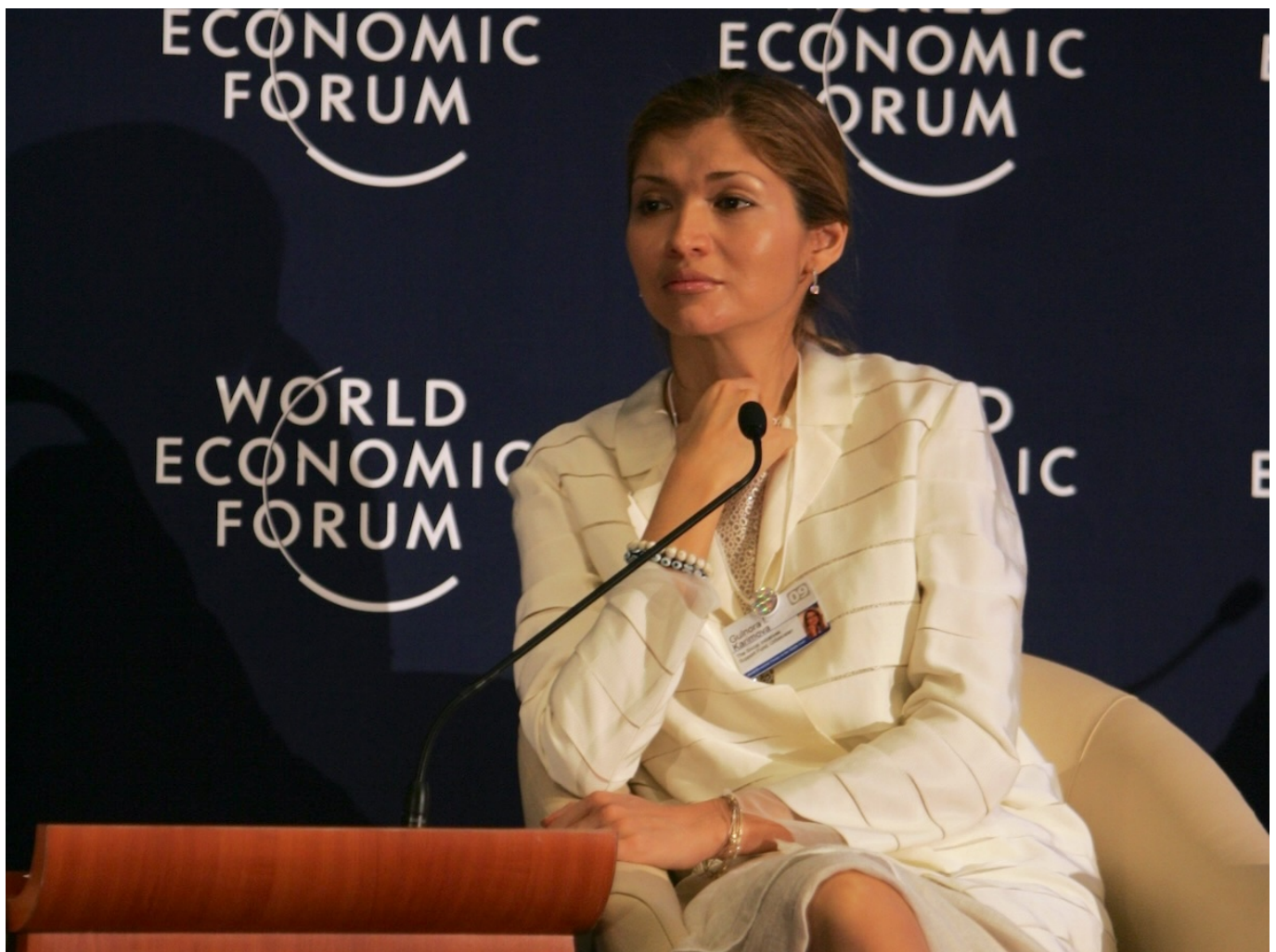
Гульнара Каримова на ВЭФ в 2009 году.

Auteur: Заррина Салимова, Берн , 04.07.2025.