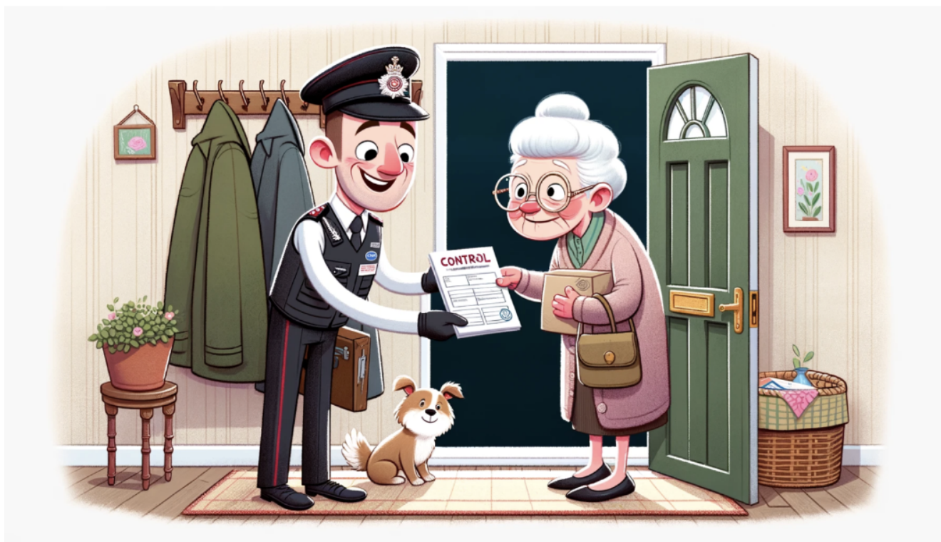
Иллюстрация с сайта Полиции кантона Во

Auteur: Надежда Сикорская, Женева-Лозанна , 10.07.2025.