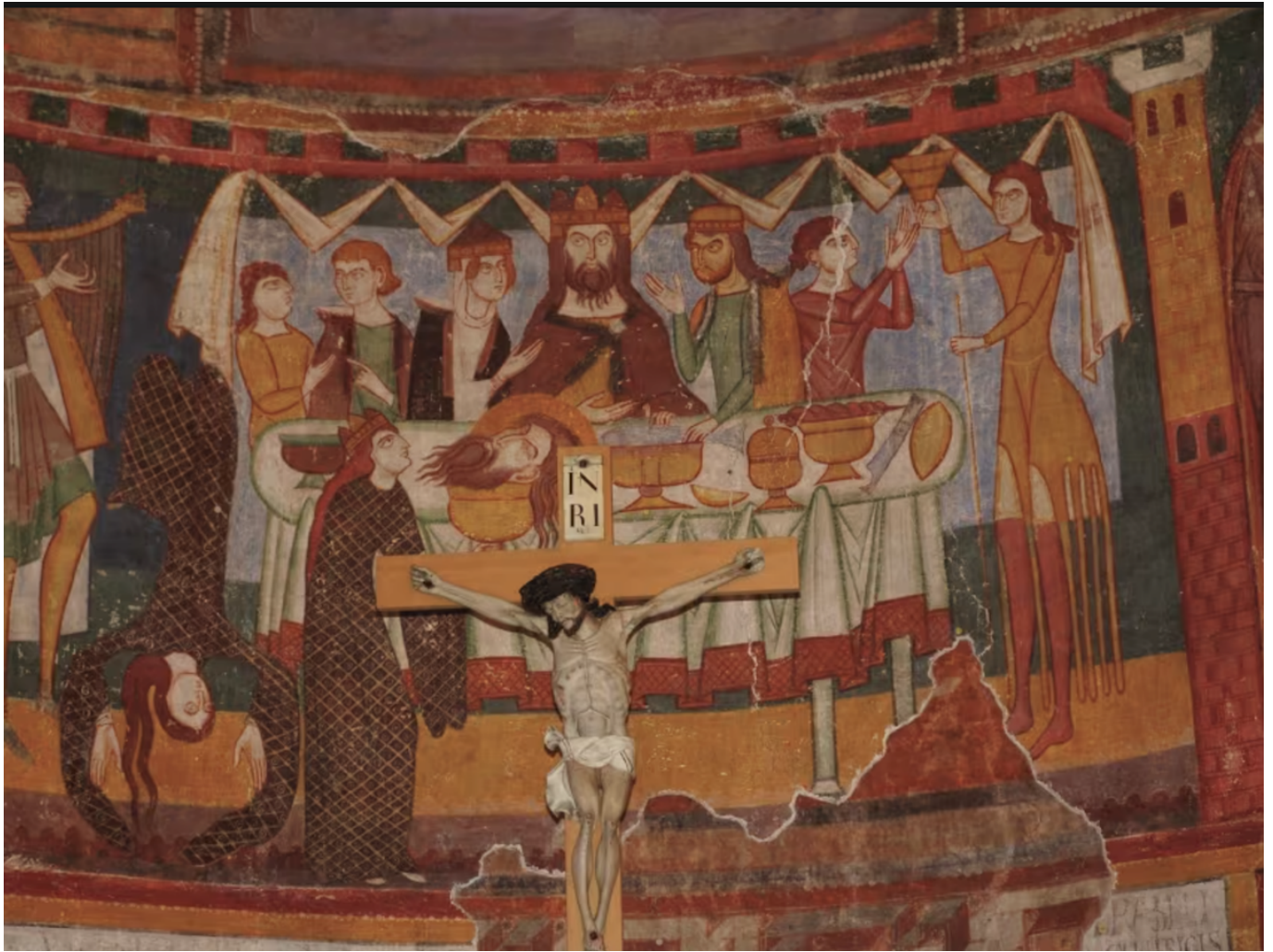
Фрески в монастыре Св. Иоанна

большой и хорошо сохранившийся цикл фресок эпохи Высокого Средневековья.