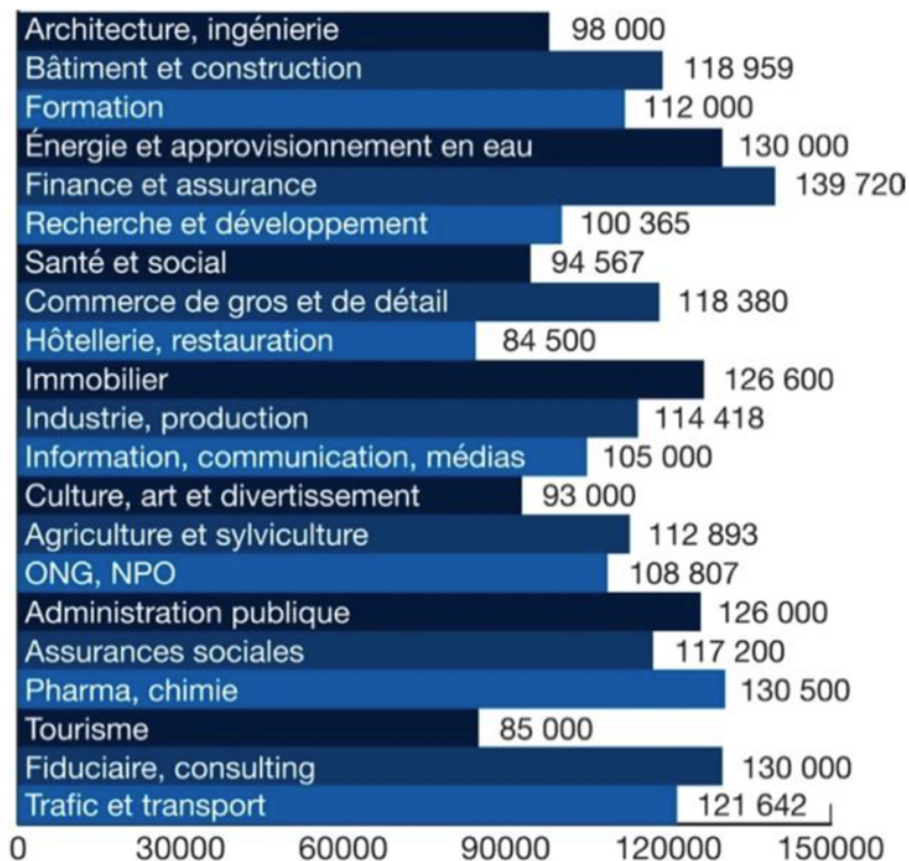
Медианная зарплата по секторам экономики. График из исследования HES Salaire 2025

Женщины зарабатывают меньше мужчин, что объясняется несколькими причинами. Прежде всего, большинство мужчин работают в частном секторе, в то время как женщины, как правило, заняты в государственном. Кроме того, мужчин чаще работают в сфере технологий и ИТ, где заработная плата в среднем выше. На зарплату влияет и уровень занятости. Почти 39% участников опроса заявили, что работают неполный рабочий день (максимум 90%): этот показатель составляет около 27% среди мужчин и достигает 58% среди женщин. Печально, что намного больше мужчин получили в этом году более значительное повышение зарплаты, чем женщины: семь из десяти женщин получили максимальное повышение в размере 2% или вообще никакого.