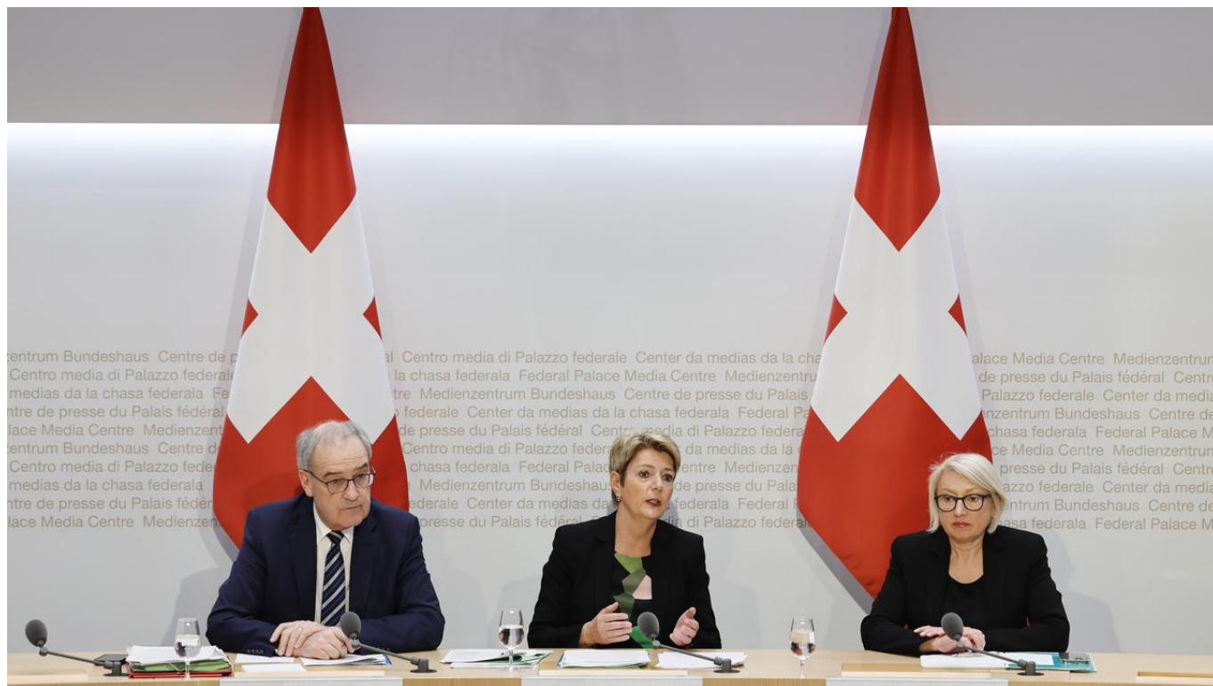
Ги Пармелен, Карин Келлер-Суттер и Урсула Эггенбергер на пресс-конференции Федерального совета 3 апреля 2025 года после объявления о тарифах США.