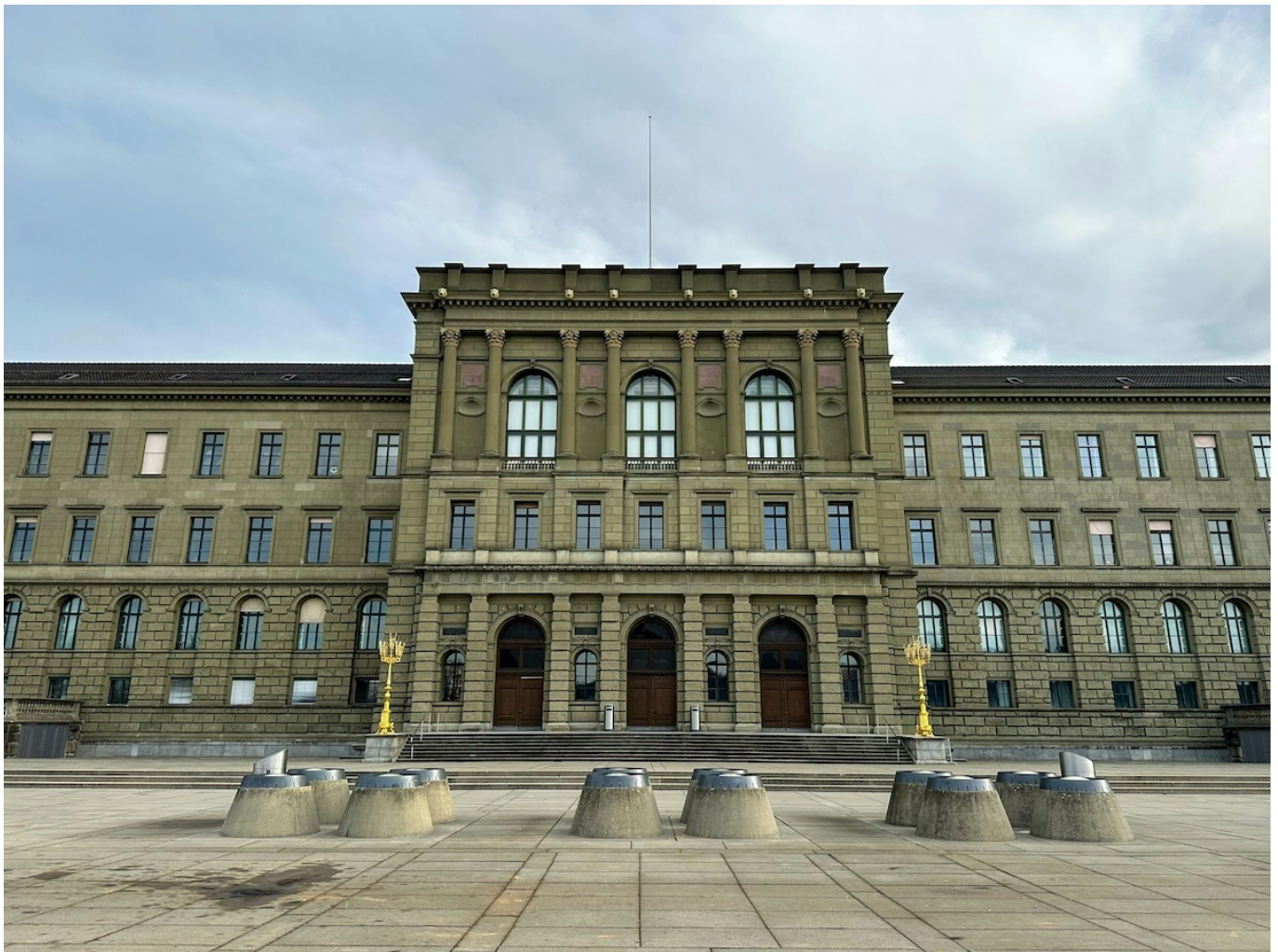
Здание ЕТН в Цюрихе.

Auteur: Заррина Салимова, Цюрих , 19.03.2025.