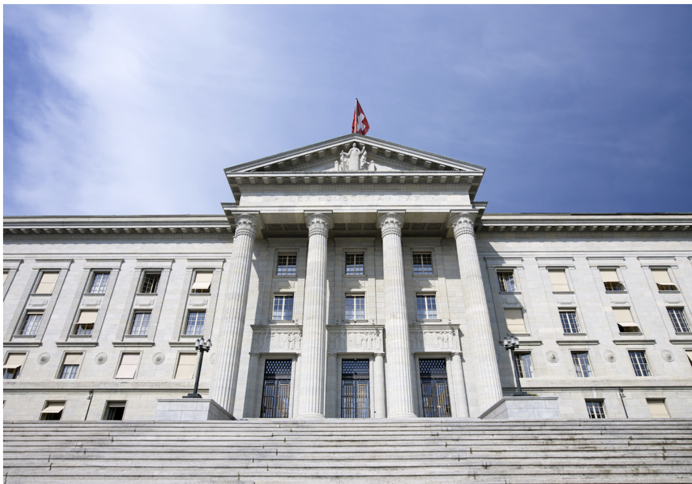
Здание Федерального суда в Лозанне

Auteur: Заррина Салимова, Лозанна , 27.02.2025.