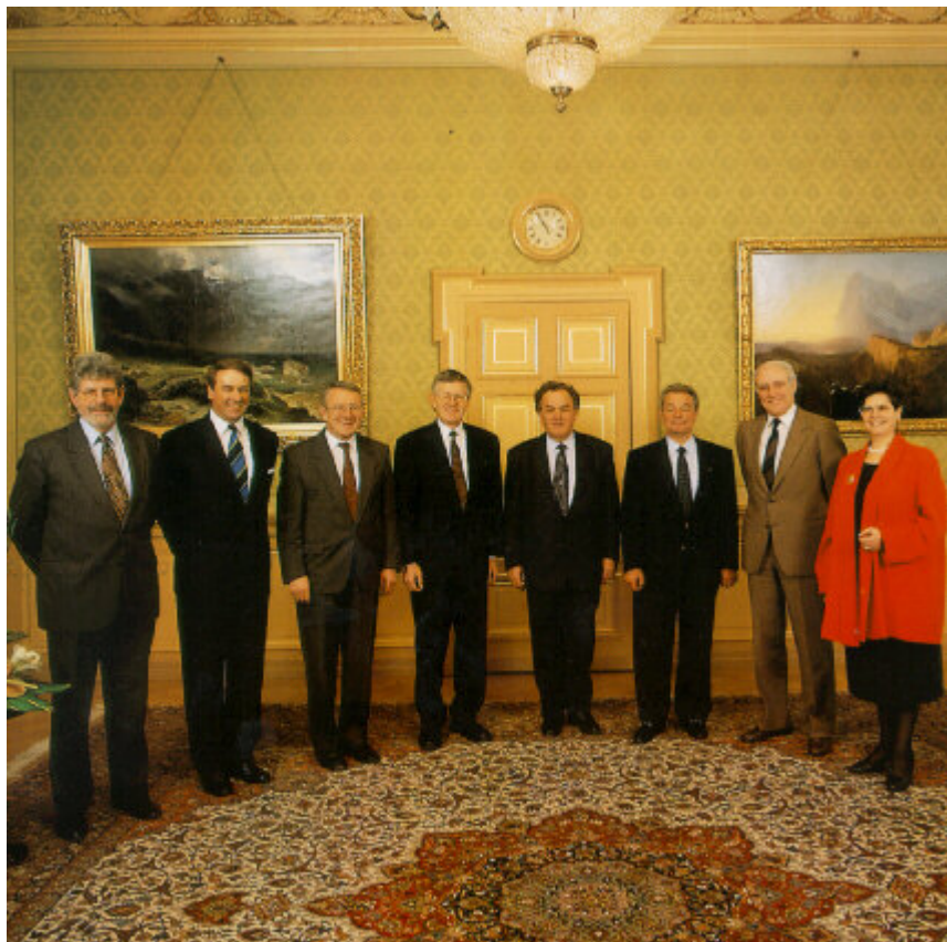
Федеральный совет в 1994 году. Слева направо: канцлер Франсуа Кушпен и федеральные советники Адольф Оги, Арнольд Коллер, Каспар Филлигер, Отто Штих, Жан-Паскаль Деламяра, Флавио Котти, Рут Дрейфус.

Сам же Федеральный совет в 1994 году столкнулся с кризисом доверия, так как оказался не всегда способным «вести народ за собой»: на избирательных участках провалилось предложение об участии Швейцарии в миротворческих операциях ООН, конституционная статья о содействии культуре и упрощенная натурализация для молодых людей иностранного происхождения. Однако правительство выиграло голосование о присоединении Швейцарии к Конвенции ООН против расизма.