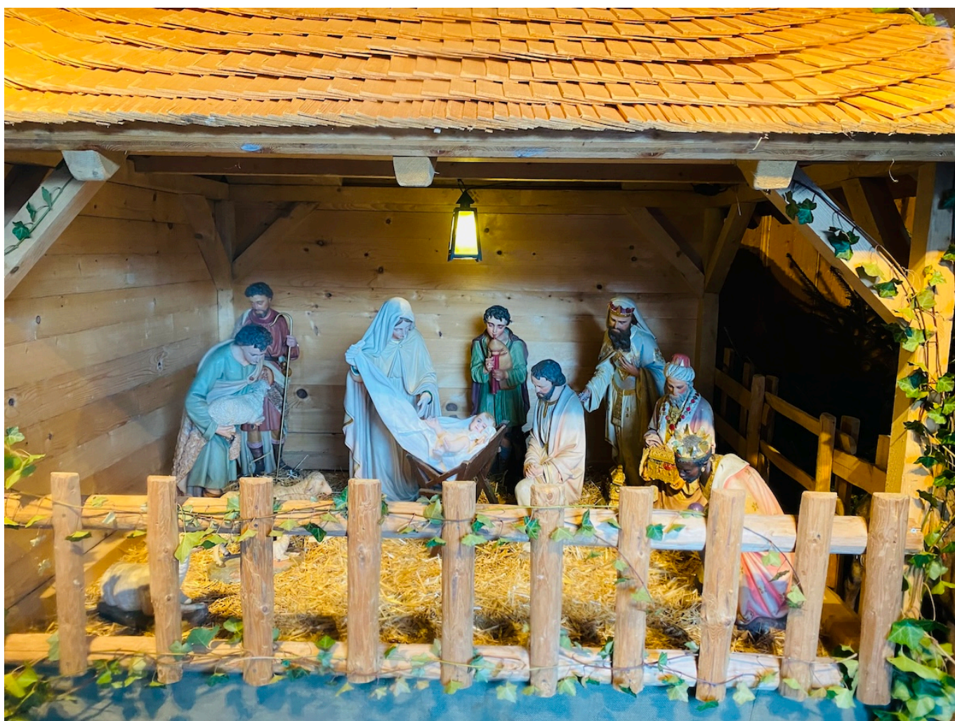
Рождественский вертеп в церкви Грюейра.

Auteur: Заррина Салимова, Берн , 03.01.2025.