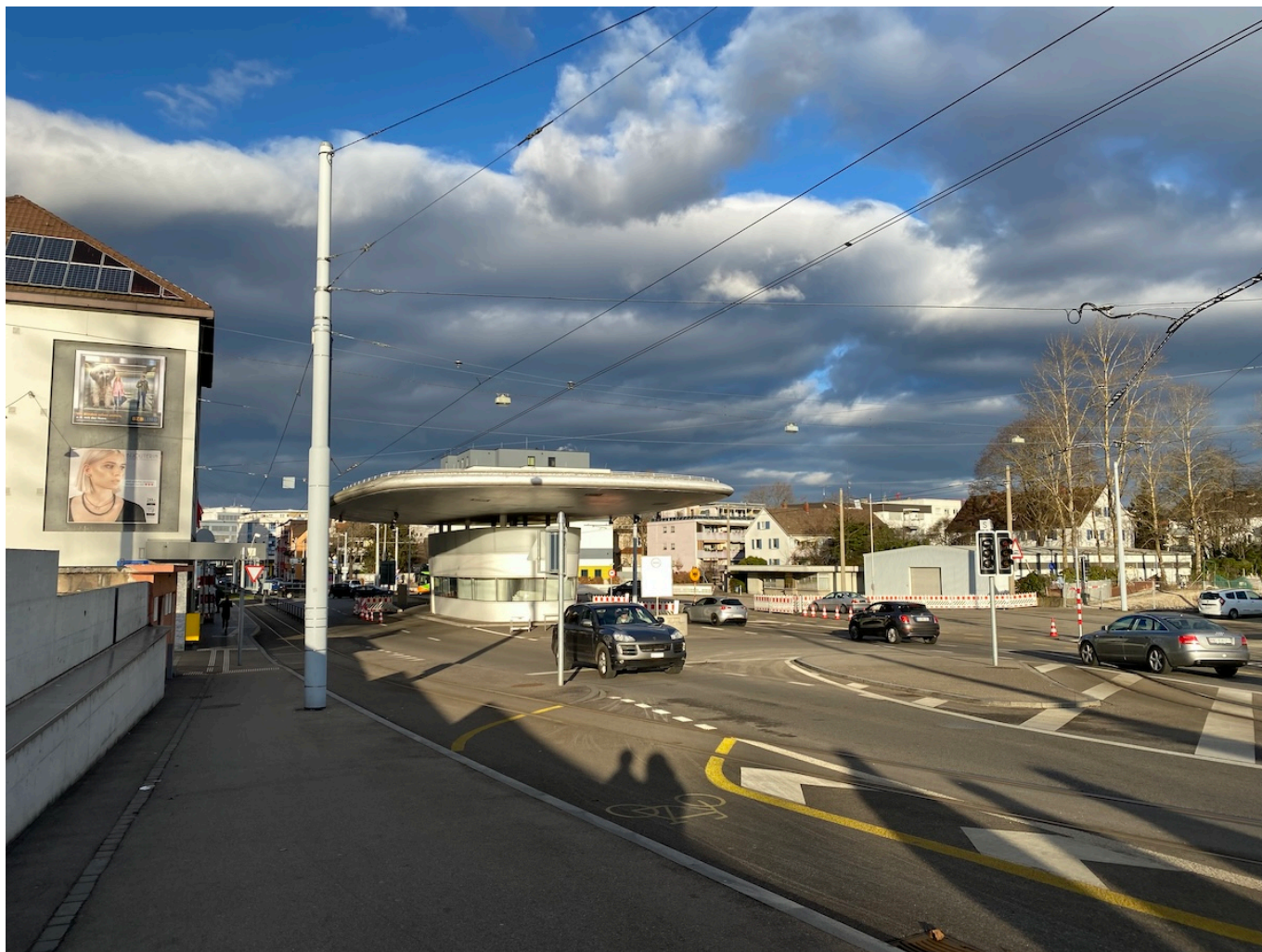
Таможенный пункт в Базеле.

Auteur: Заррина Салимова, Берн , 06.11.2024.