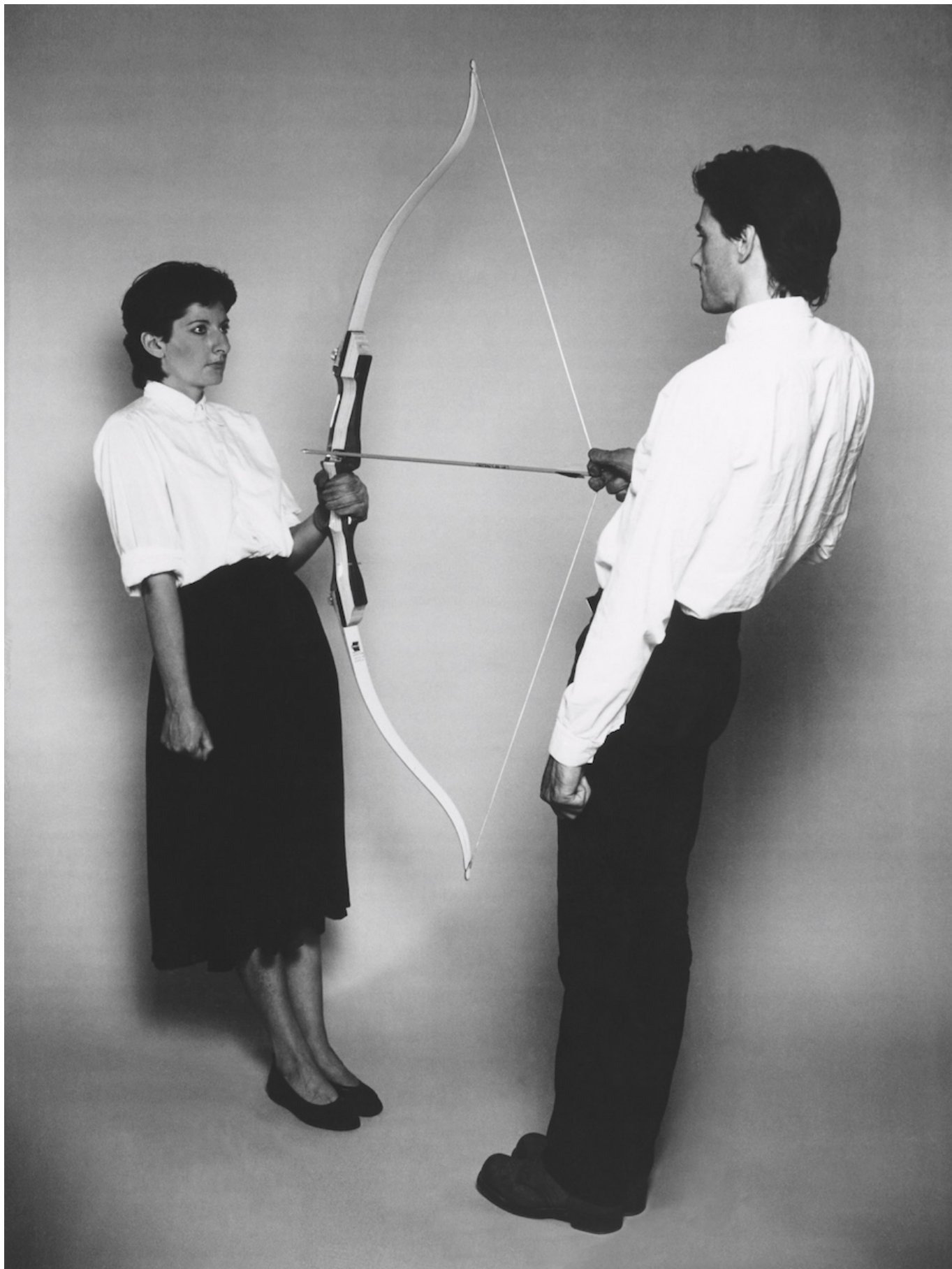
Ulay / Marina Abramović, Rest Energy , 1980 Performance pour vidéo, 4', ROSC' 80 Dublin

Экспозиция охватывает 55 лет творческой деятельности художницы, родившейся в 1946 году в Белграде. В поисках своего художественного языка Марина Абрамович