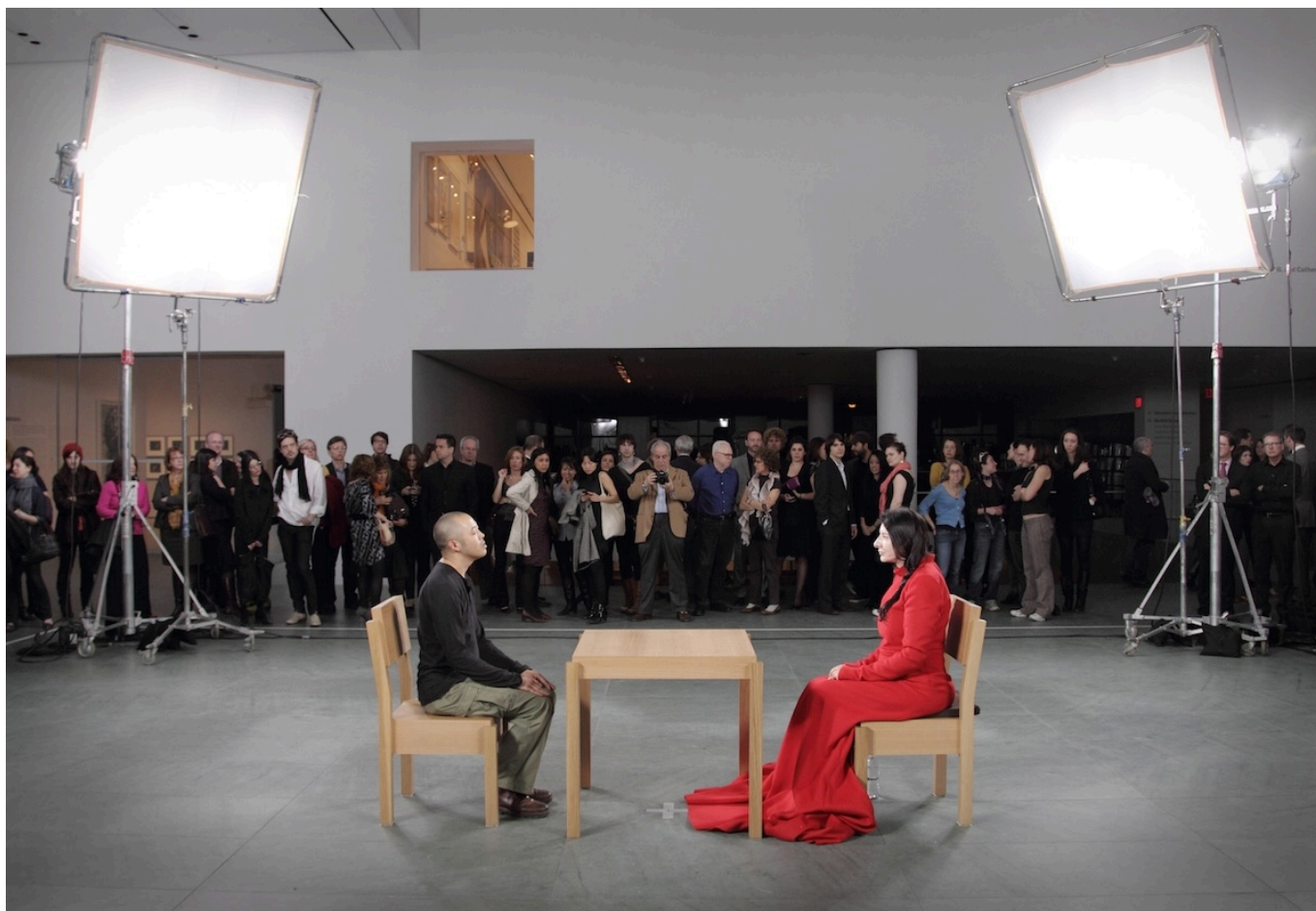
Marina Abramović, The Artist is Present, 2010 Performance, 3 mois, The Museum of Modern Art, New York

она заинтересовалась психическими трансформациями и темой «исцеления». В 2010 году в Музее современного искусства в Нью-Йорке она поставила перформанс «The Artist Is Present», принесший ей невероятную популярность. В течение трех месяцев она просто сидела на стуле по восемь-десять часов в день. Напротив стоял еще один стул, куда мог сесть любой из зрителей. За 90 дней Марина Абрамович заглянула в глаза более 1500 человек. Музей стал местом паломничества.