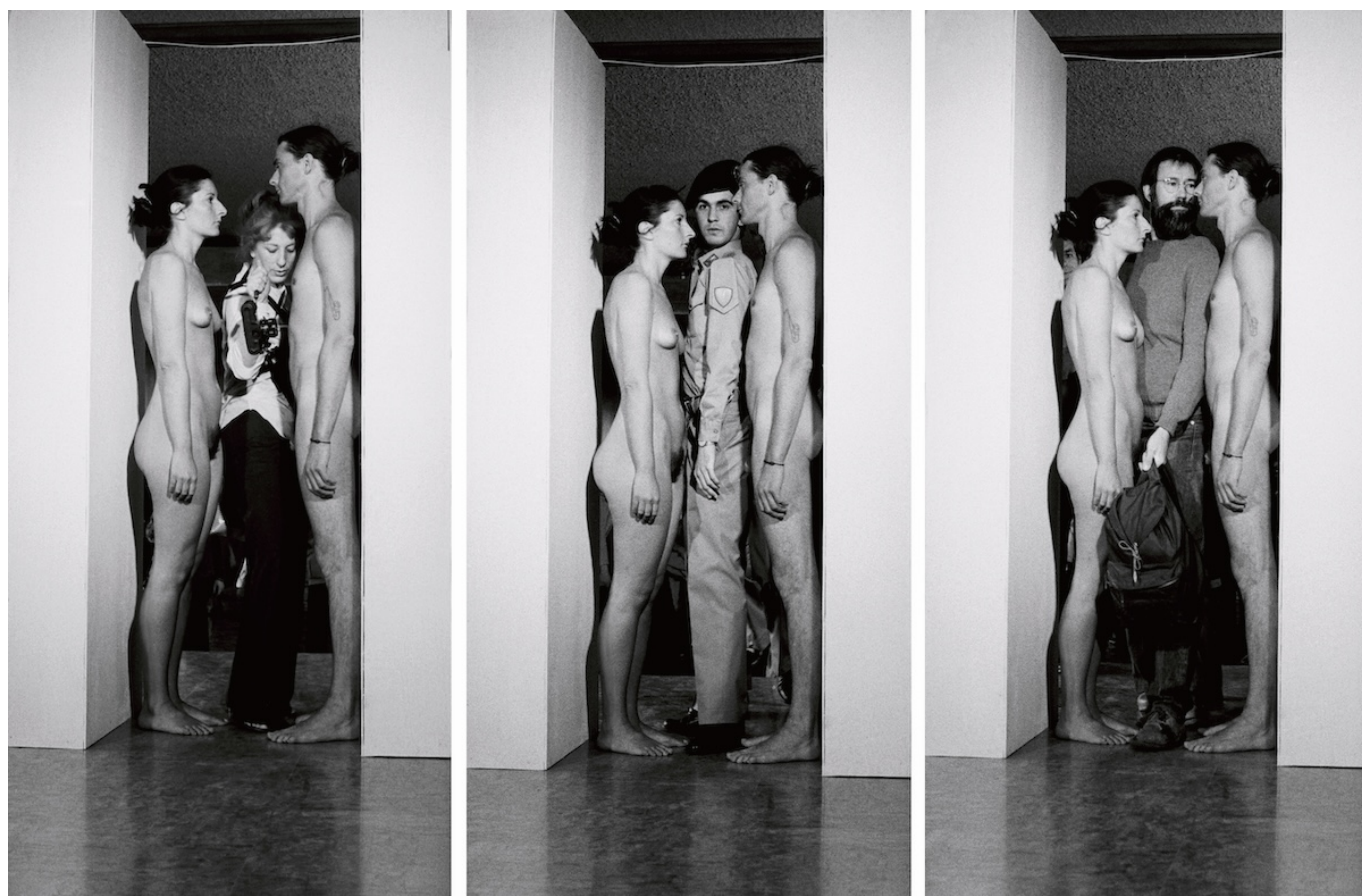
Ulay / Marina Abramović, Imponderabilia, 1977 Performance, 90', Galleria Comunale d'Arte Moderna, Bologna

реперформансы с участием 24 современных художников. Когда в ходе беседы в день открытия выставки модератор спросила Марину Абрамович о какой-то из ее работ сорокалетней давности, художница предложила поговорить о чем-то более интересном, например, о том, что ни один из ее перформансов 70-х годов невозможно повторить сегодня. Действительно, из-за политкорректности, новых правил безопасности, боязни «оскорбить» чьи-либо чувства и других всевозможных ограничений радикальные работы приходится адаптировать. И художница готова идти на здоровый компромисс. Так, во время первой демонстрации «Imponderabilia» в 1977 году в Болонье все другие входы в музей были заблокированы – публика была вынуждена протискиваться между двумя абсолютно голыми людьми, стоящими друг напротив друга. В Кунстхаусе же для посетителей, желающих избежать телесного контакта, предусмотрены еще два других входа. Помимо «Imponderabilia» в Цюрихе можно будет увидеть реперформансы «Luminosity», а также «Art is Beautiful».