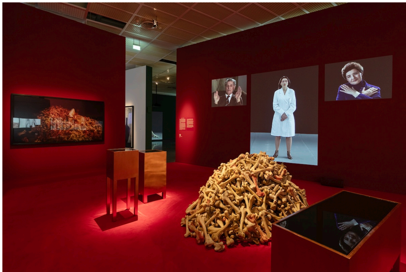
Kunsthaus Zürich, 2024

Вторая часть экспозиции более интерактивна: публика может стать частью перформансов, например, засесть за медитативную работу и отделить зерна риса от чечевицы, примерить каменные башмаки, прикоснуться лбом к минералу или пройти через портал из кристаллов. На открытии выставки Марина Абрамович не удержалась от ироничной критики в адрес швейцарцев, посоветовав им побольше смеяться над собой. Чтобы расшевелить и расслабить зажатых швейцарцев, художница, специально для ретроспективы в Кунстхаусе, сделала «декомпрессионную камеру»: посетителям предлагается запереть мобильные телефоны в шкафчике, надеть шумоподавляющие наушники и спокойно полежать шезлонге.