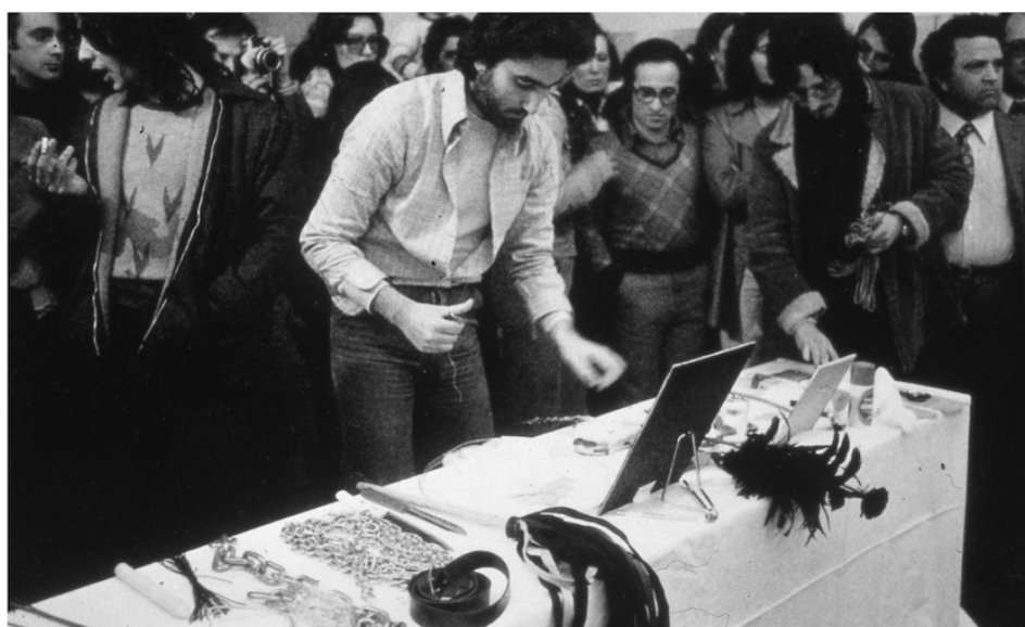
Marina Abramović, Rhythm 0, 1974 Performance, 6 heures, Studio Morra, Neapel

Часть ретроспективы посвящена дуэту Марины Абрамович с Улаем, с которым она познакомилась в 1975 году. Их отношения – личные и творческие – продлились до 1988 года, а их совместные перформансы представляли собой физическое исследование границ друг друга, взаиморастворение и симбиоз. Так, в одной из работ она держала лук, а он – направленную в ее сердце стрелу. В «Breathing In/Breathing Out» (1977) они вдыхали и выдыхали через рот, как при поцелуе, один и тот же воздух, пока оба чуть не теряли сознание от нехватки кислорода. А проект, который должен был стать символом их любви, закончился расставанием. 27 июня 1988 года Абрамович и Улай встретились в центре Великой китайской стены. Они шли на встречу друг к другу три месяца: Улай – с запада, а Марина – с востока. Изначально они планировали пожениться в месте встречи, но на подготовку проекта и получение разрешений ушли годы. Когда они все-таки осуществили свой план, о свадьбе не было и речи – они поняли, что это конец их отношений.