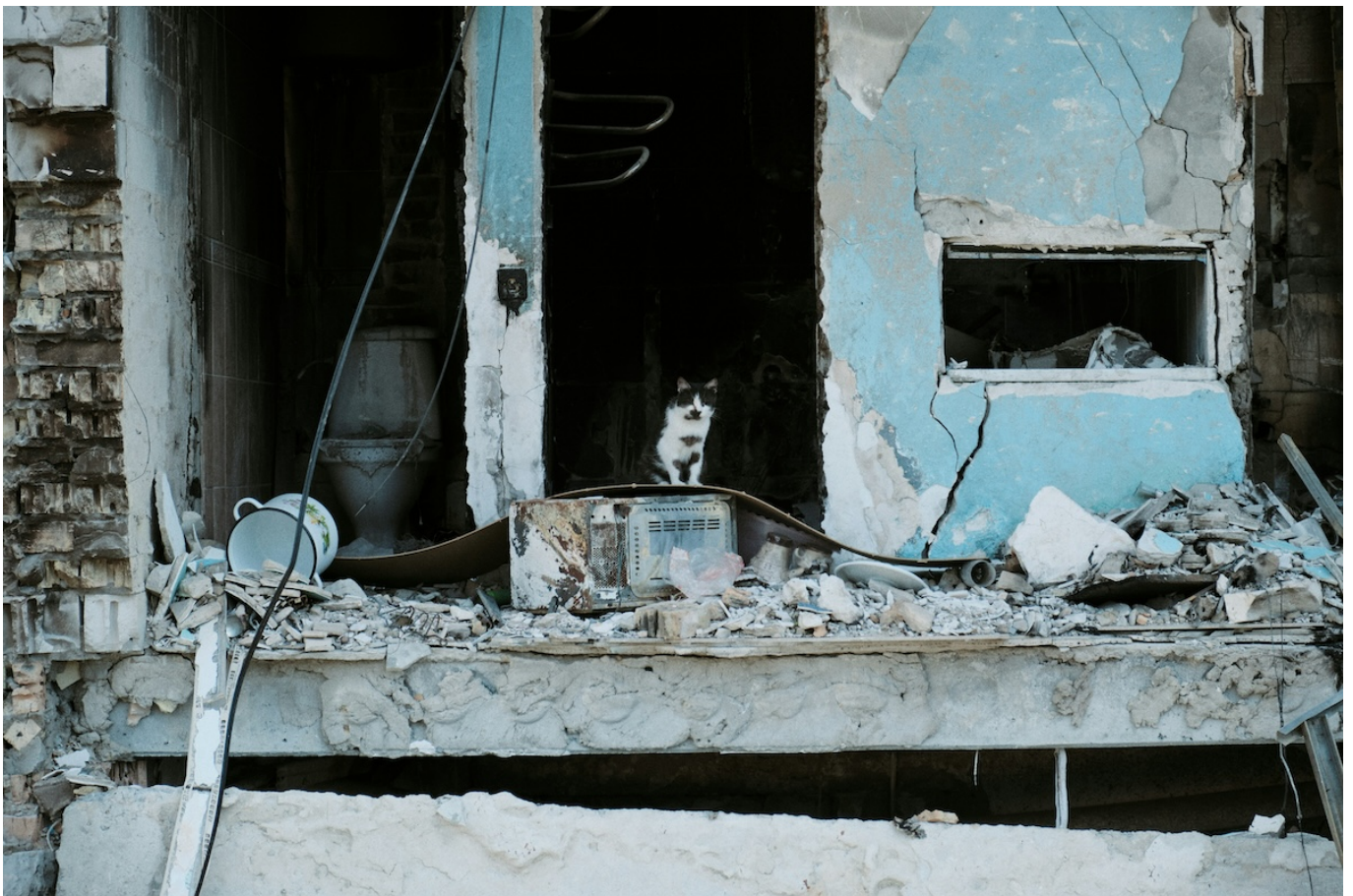
Руины дома в Бородянке.

Auteur: Заррина Салимова, Цюрих , 09.10.2024.