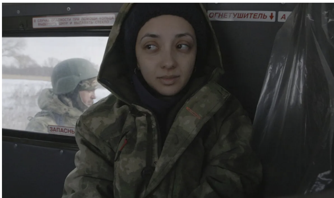
Кадр из фильма «Русские на войне»