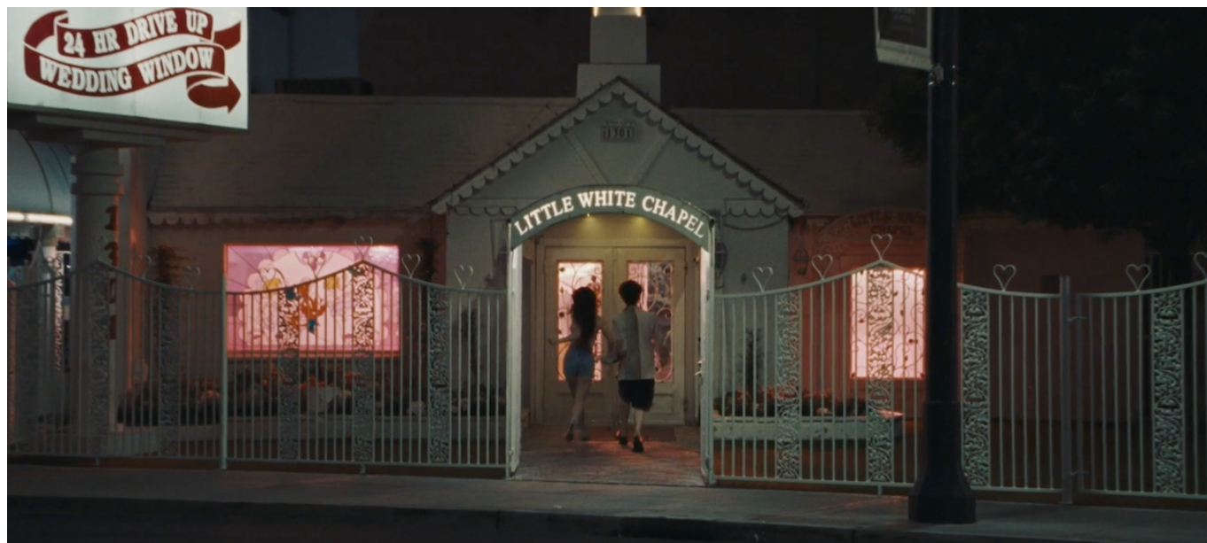
Кадр из фильма «Анора»

которой через рассказ о влюбившейся в таксиста 70-летней вдове говорится о репрессиях в отношении женщин в стране. Не пропустите румынскую картину «Новый год, который так и не наступил» о жизни жителей страны накануне революции и том, как мало нужно было сделать в то время, чтобы свергнуть режим Чаушеску. Кроме того, в Цюрихе покажут американскую сатирическую комедию «Анора»: история любви 25-летней стриптизерши узбекского происхождения и 21-летнего сына русского олигарха, живущих в Нью-Йорке и решивших спешно пожениться в Лас-Вегасе, не оставила равнодушными членов жюри Каннского фестиваля, присудивших картине «Золотую пальмовую ветвь».