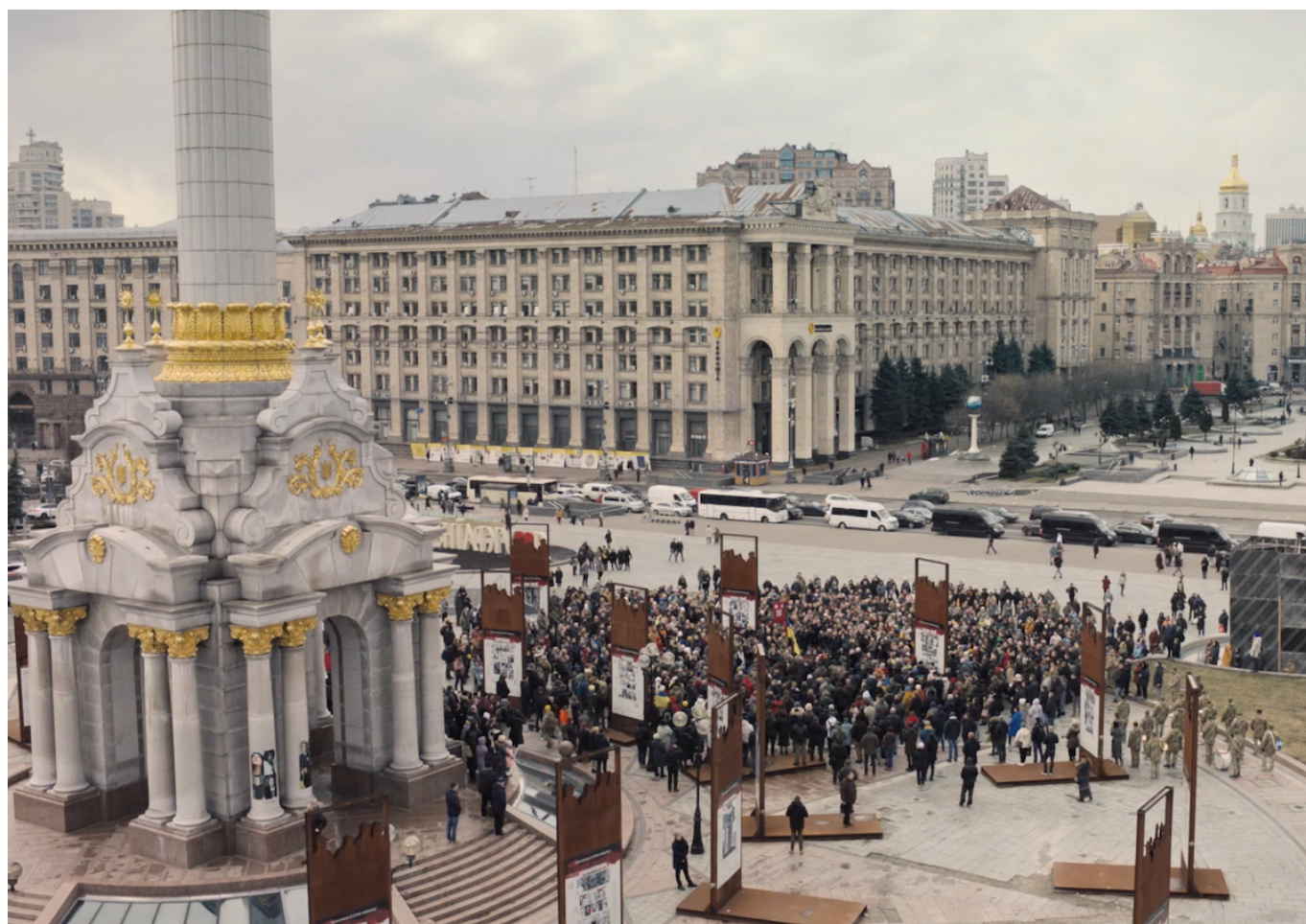
Кадр из фильма «Вторжение»

Скандал с фильмом Анастасии Трофимовой заполнил все медийное пространство и отвлек внимание от других лент фестиваля, а ведь в программе немало по-настоящему достойных картин! Так, в секции «Border Lines», куда включены фильмы, посвященные актуальным вопросам мировой политики, правам человека, социальной напряженности, конфликтам между личностью и государством, представлена новая работа хорошо знакомого нашим читателям украинского режиссера Сергея Лозницы . Его фильм «Вторжение» критики называют документальным эпосом. Режиссер в течение двух лет снимал повседневную жизнь украинцев во время войны, отдав дань уважения их стойкости и создав монументальную картину о нации, борющейся за свою свободу. Картина будет демонстрироваться 4, 9 и 12 октября.