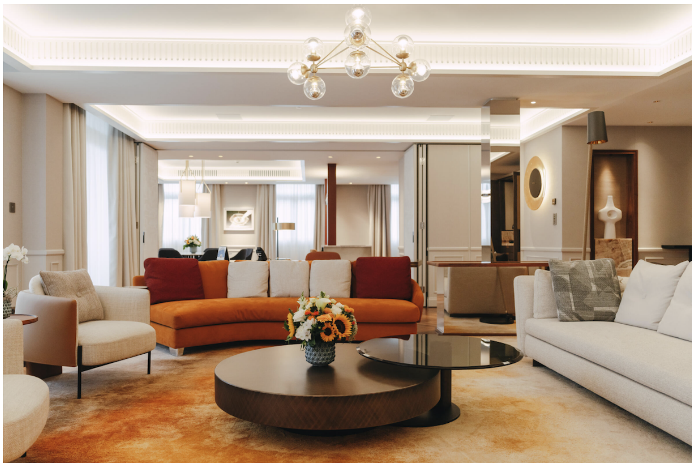
Президентский люкс.