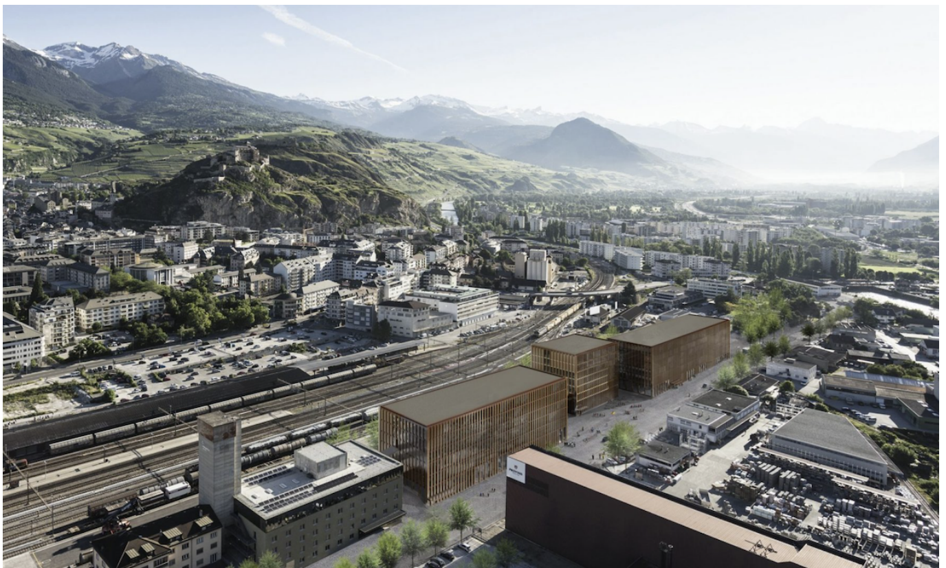
Кампус EPFL в Сионе

Auteur: Заррина Салимова, Лозанна-Сион-Фрибург , 26.08.2024.