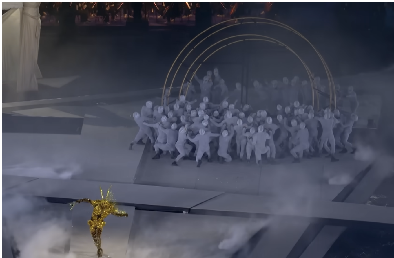
Скриншот записи церемонии открытия

Нашим постоянным читателям это имя может показаться смутно знакомым – и не зря. Мы уже рассказывали о творчестве 32-летнего уроженца кантона Вале, когда он решил удивить гостей парижской недели моды, устроив модный показ под аккомпанемент валезанского духового оркестра. Новый толчок его карьере дала Олимпиада: организаторы доверили швейцарскому дизайнеру, наряды от которого носят Тейлор Свифт, Леди Гага, Бейонсе и Рианна, создание костюмов для финального шоу.